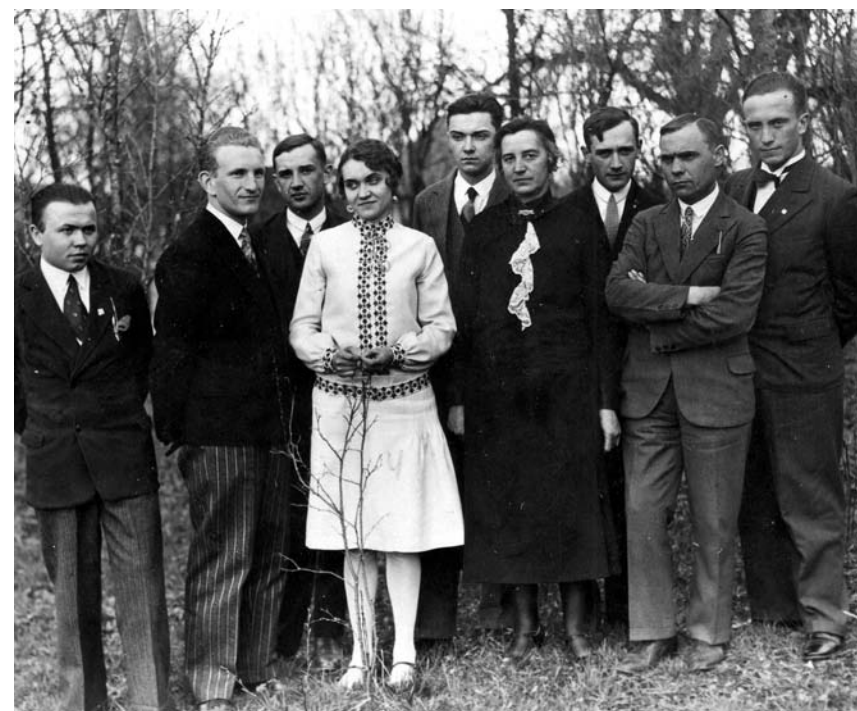
Зліва праворуч: невідомий, Роман Шухевич, невідомий, Наталя Шухевич, Юрій Березинський, троє невідомих, Юрій Шухевич. 1930 р.

концепція провадження визвольної боротьби, опертої тільки на власні сили українського народу. Ціла структура визвольно-революційного фронту, створена в умовах важкого протистояння з могутнім ворогом, цілковито себе виправдала. Це стало найбільшим успіхом Головного командира, і цей успіх — найкращий та найтривкіший пам'ятник для нього.