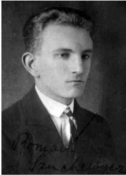
Фотографія зі студентської справи Романа Шухевича, 1926 р.

на колінах різьблений в камені св. Антоній. Потім розходила-ся наша п'ятка в різні сторони, насторожена, обережна» 50 .