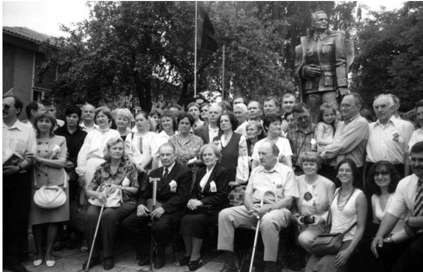
Родина Шухевичів на з'їзді, що відбувався 10–12 липня 2005 р. в с. Тишківці

присвячені національно-визвольній боротьбі. На батьківщині родини Шухевичів у с. Тишківцях теж створено музей, а у четверту річницю незалежності України для увіковічнення пам'яті Романа Шухевича відкрито йому пам'ятник (скульптор А. Басюк).