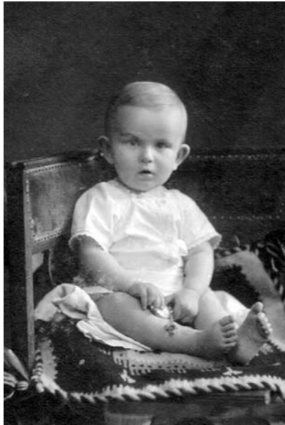
Роман Шухевич, 1908 р.

* * * Народився Р. Шухевич 30 червня 1907 р. у Львові 13 . На виховання майбутнього провідника великий вплив мали його батьки та родина. Рід Шухевичів належить до давніх заслужених священичих родин. Він відіграв важливу роль у національно-культурному та політичному житті Галичини впродовж XIX—XX ст. З роду Шухевичів вийшла велика когорта видатних діячів, а саме: священиків, учителів, науковців, юристів та військовиків. Багато членів родини мали музичний хист, який передався й Романові. Р. Шухевич дуже любив музику і сам грав на фортепіано. Його дружина згадувала: «Він був надзвичайно інтелігентний, культурний, строгий, але дуже добрий.