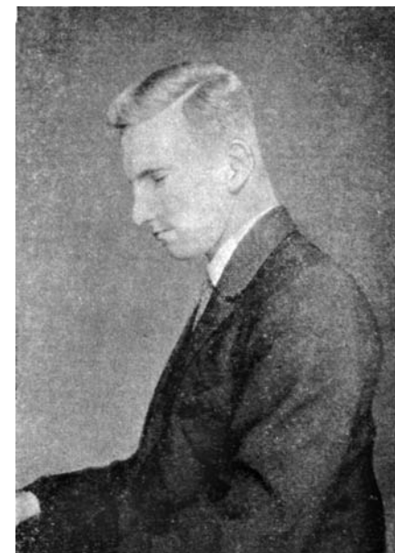
Роман Шухевич — піаніст

Після створення 2 лютого 1929 р. у Відні Організації Українських Націоналістів Р. Шухевич став бойовим референтом Крайової езекутиви ОУН (1930—1934). Завдяки Роману вдалося провести низку акцій, спрямованих проти антиукраїнської політики польської влади, зокрема: серію експропріаційних нападів на польські державні установи, які мали на меті залучити матеріальні засоби для ведення подальшої національно-визвольної боротьби 84 ; атентат 22 березня 1932 р. на комісара поліції Чеховського за знущання над українськими політв’язнями; екс 30 листопада 1932 р. на пошту в м. Городку, під час якого загинув Юрій Березинський, брат дружини Р. Шухевича; атентат на радянського консула у Львові на знак протесту проти штучного голоду в Радянській Україні (21 жовтня 1933 р. замах виконав бойовик ОУН Микола Лемик, убивши в консульстві спецуповноваженого НКВД Олексія Майлова); атентат на міністра внутрішніх справ Броніслава Перацького, організатора «пацифікації» (його виконав 15 червня 1934 р. в Варшаві бойовик ОУН Гриць Мацейко). У червні 1934 р. у зв’язку з убивством Б. Перацького поліція провела масові арешти серед членів ОУН. 18 червня арештовано Р. Шухевича і згодом, 6—7 липня, заслано до концентраційного табору в Березі Картузькій без достатніх доказів провини. У таборі Романа приписали до групи кочегарів, які взимку носили вугілля та розпалювали печі. Але й тут він очолив націоналістичну організацію самооборони. Один із таборових в’язнів