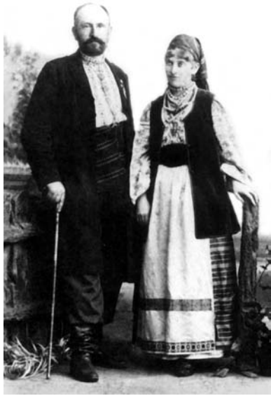
Володимир Шухевич з дружиною Герміною. 1894 р.

У 1970 р. під час відпустки їздив до матері у Львів, а по дорозі відвідав своїх знайомих. Спілкувався з людьми схожої з ним долі й переконань, написав проблемну статтю про визвольну боротьбу «Роздуми вголос», за яку був засуджений на 10 років тюрми особливого режиму і 15 років заслання. Юрій надсилав викривальні статті в ООН, у різні правозахисні організації. За це його повторно засудили у липні 1973 р. на 10 років, звинувативши в спробі передати на волю свої статті з національного питання. У тюрмі в Чистополі Татарської АРСР у 1981 р. він втратив зір. 7 січня 1982 р. йому зробили операцію на очі, але невдало. Після закінчення терміну ув'язнення, 1983 р., його заслали до Сибіру, а потім відправили в інвалідний будинок у Томській області.