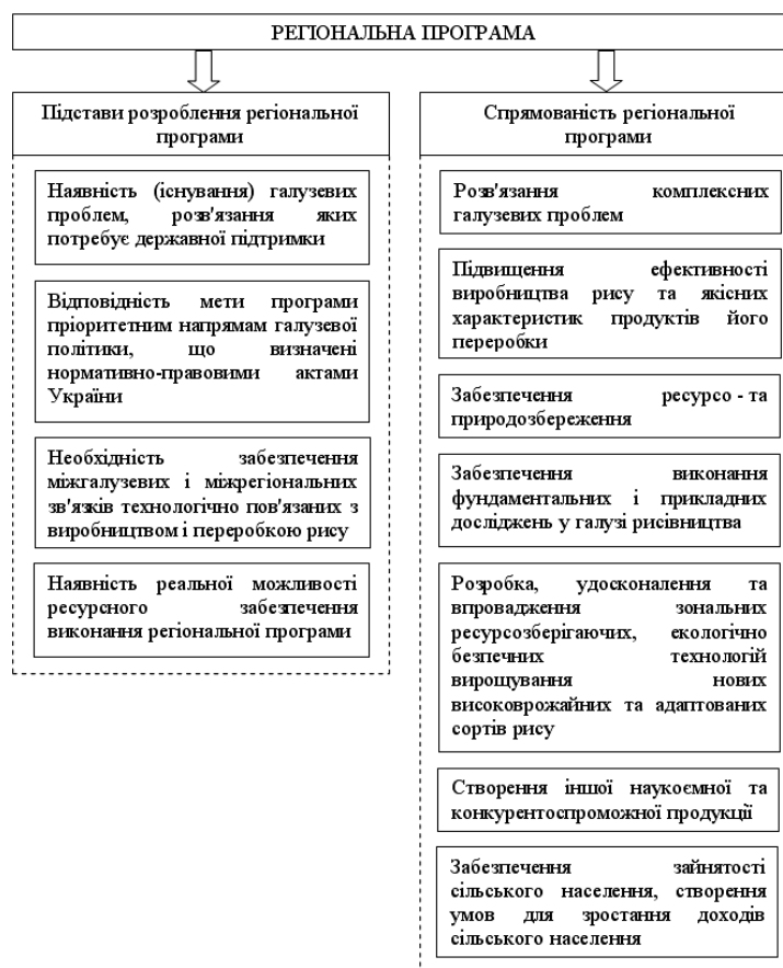
Рис. 2. Спрямованість і основні підстави розроблення регіональної програми розвитку рисівництва *