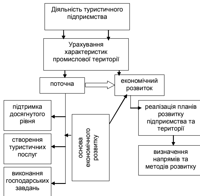
Рис. 1. Процес діяльності туристичного підприємства на промисловій території.

Для посилення сутності цієї дефініції необхідно розглянути процес діяльності туристичного підприємства з урахуванням особливостей промислової території, який може бути представлений двома частинами: частина поточної діяльності та частина розвитку (рис. 1). Перша характеризує підтримку поточної діяльності на досягнутому економічному й соціальному рівні та виробництво туристичних послуг. Господарськими завданнями на цьому етапі, аналогічно до підприємств інших галузей, є отримання прибутку, виплата заробітної плати; ефективно використання потужностей; виконання договірних зобов'язань. Друга - вирішує проблеми, пов'язані з перспективою розвитку та підвищенням конкурентоспроможності туристичного підприємства й території.