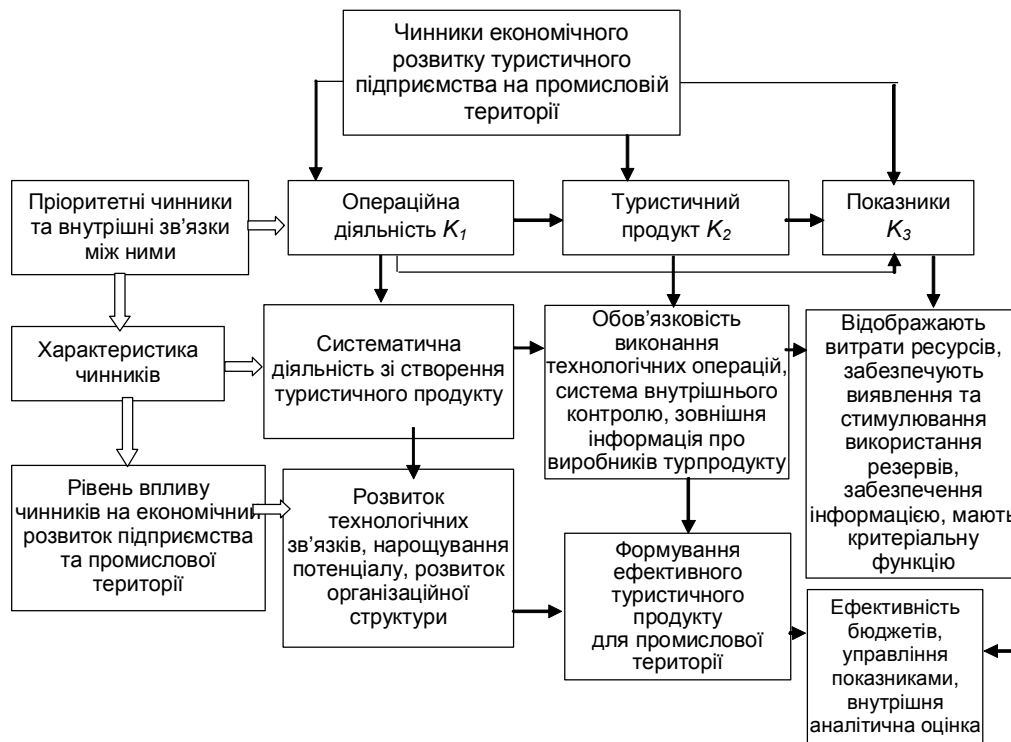
Рис. 3. Концептуальна схема вибору чинників економічного розвитку туристичного підприємства на промисловій території.

від реалізації товарів, виконаних робіт, наданих послуг.