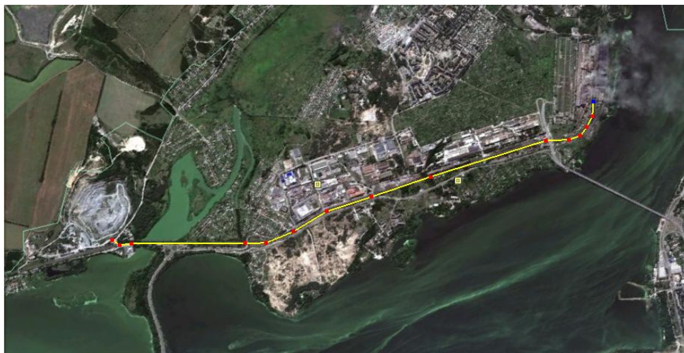
Рис.2 – Схема гидротранспорта золоотходов Приднепровская ТЭС - Рыбальский карьер

Для реализации научных разработок, их координации среди научно-исследовательских академических, отраслевых, учебных, проектных институтов и предприятий Институт геотехнической механики на протяжении всей своей плодотворной научной деятельности организовывал совместно с другими учреждениями и проводил Всесоюзные семинары, конференции, совещания, симпозиумы. Так, например, в 1969-1970 г.г. были проведены: Всесоюзный семинар по борьбе с выбросами породы, по механике горных пород (май 1969 г.), конференция по проведению, креплению и охране горных выработок (ноябрь 1969 г., г. Тбилиси), по термомеханическому разрушению горных пород (май 1969 г.), по глубоким карьерам (май 1970 г.), по горной механике (июнь 1970 г.), Всесоюзное совещание по борьбе с выбросами угля, газа и пород (май 1970 г., МакНИИ).