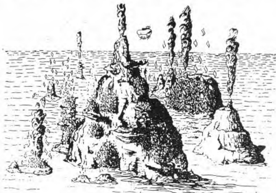
Рис. 2. Характерные гидротермальные башни на дне котловины Гуйаймае (черные курильщики) (по данным наблюдений с борта “Пайсиса”)

В районе острова Пасхи вулканические воды, уже давно поставляющие соединения железа и др. элементов (V, Mn, Mo), создали залежи “жидкой железной руды” на площади, почти равной территории Франции и Испании. Описаны ЖМК из залежей побережья Южной Африки, а также морей и озер. На дне Ботнического залива (Швеция) открыты значительные запасы марганцевых конкреций, а небольшая глубина моря в этом регионе допускает их промышленную добычу [40]. С. Рой обращает внимание на ряд