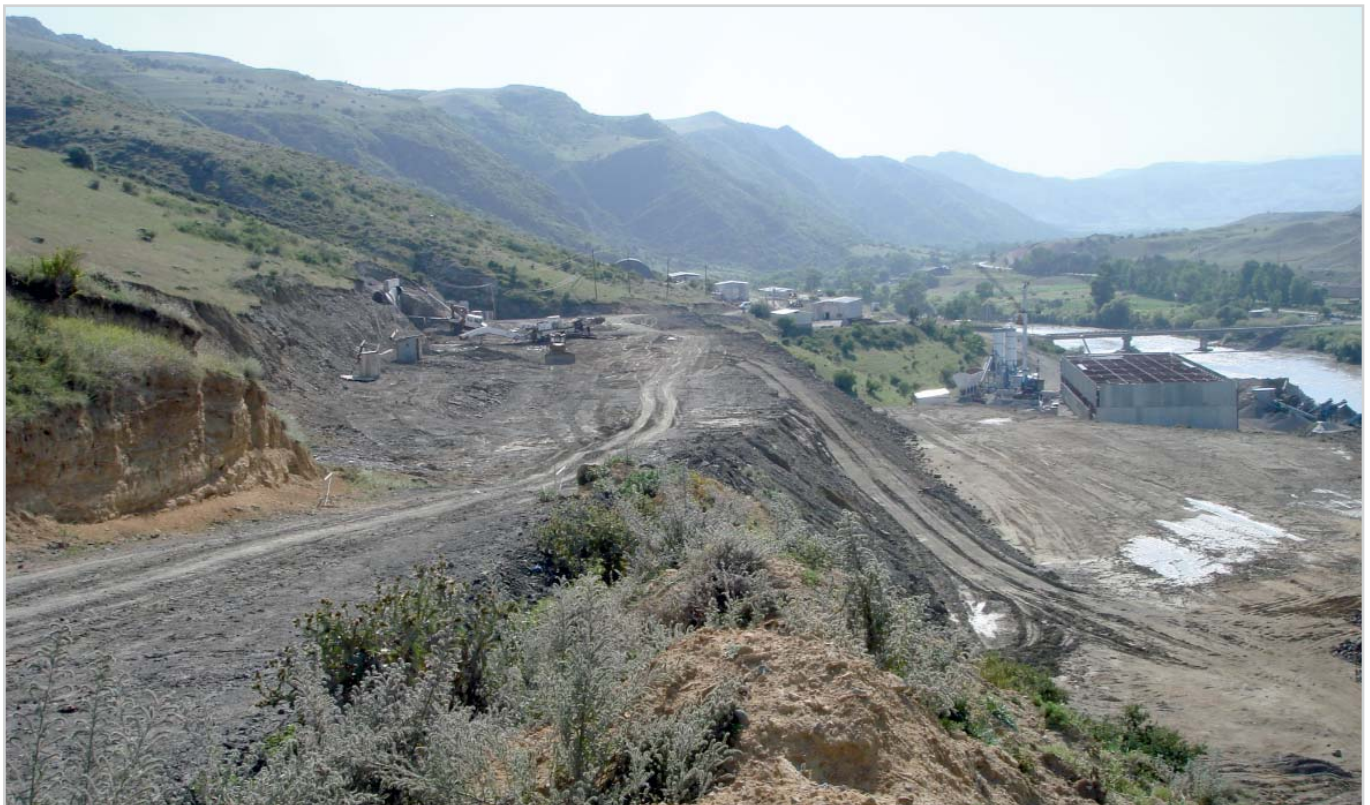
Строительная площадка МтквариГЭС

тери напора, что позволит увеличить установленную мощность ГЭС Мтквари и выработку электроэнергии.