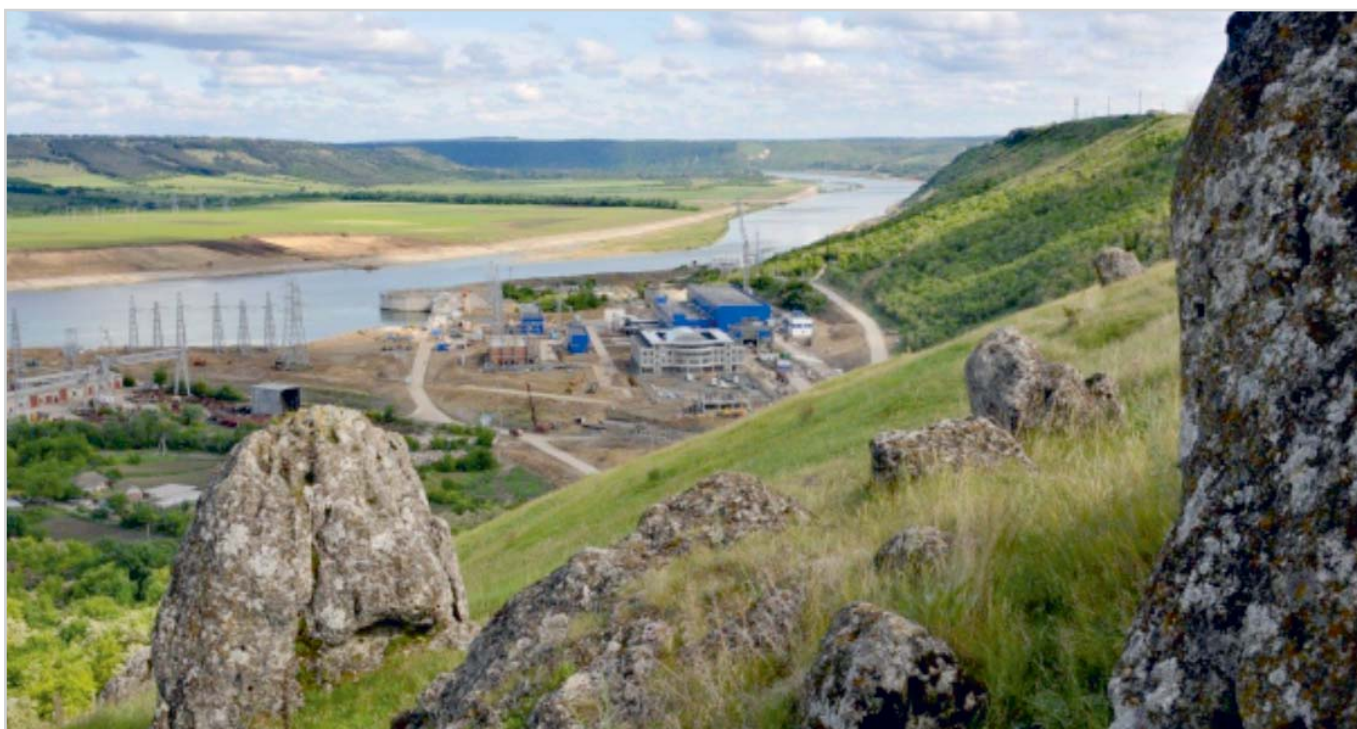
Рис. 2. Фрагмент Дністровського схилу в естественному стані.

Организация мониторинга — история и настоящее. Принципиальные подходы к созданию и организации системы натурального контроля Дністровської ГАЭС основывались, с одной стороны, на положениях нормативных и рекомендательных документов, действующих в то время в области гидроэнергетического строительства, когда обязанности за организацию контроля за безопасностью строящихся сооружений возлагали на