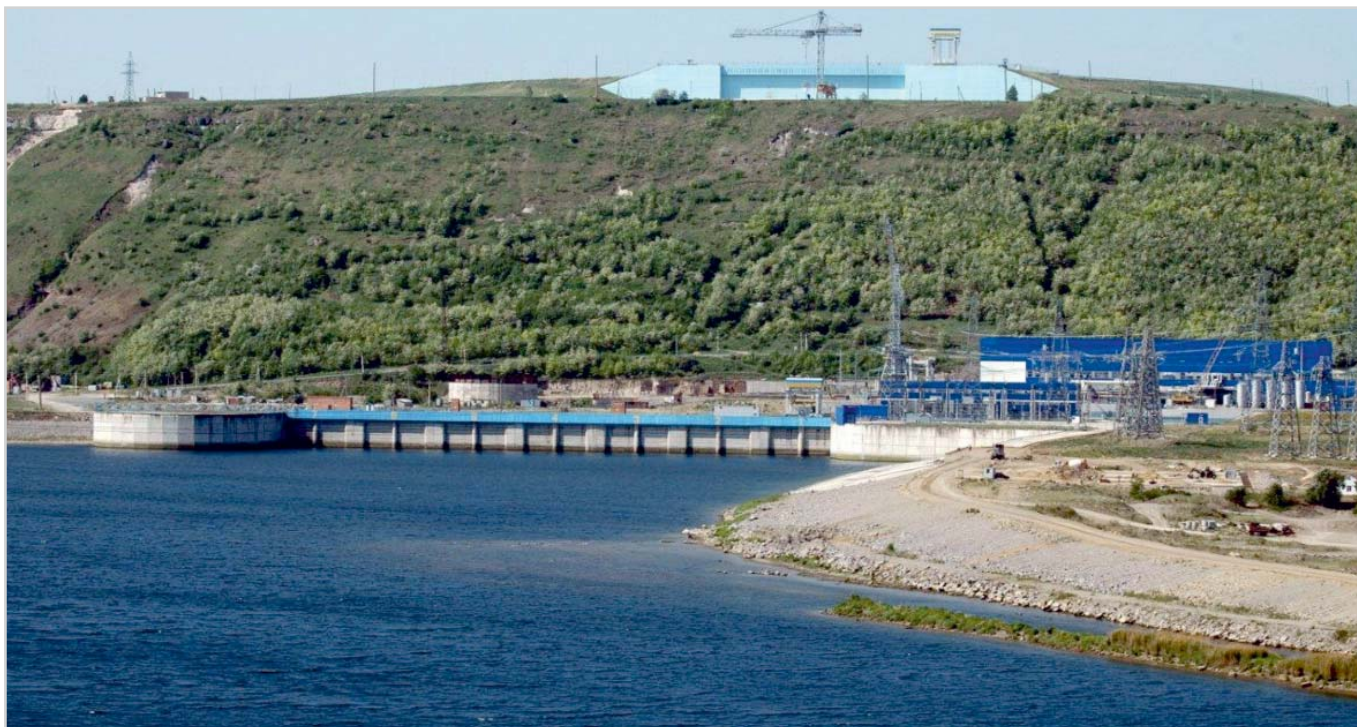
Рис. 1. Дністровська ГАЭС. Вид з нижнього б'єфа.

торія, як всім відомо, це підтвердила. Из этого следовало, что за долгие годы строительства, будет меняться и совершенствоваться система контроля, включая как ее объем, так и направления контроля и методологии. Было ясно и другое — за этот период, в силу объективных обстоятельств, будет утрачено определенное количество КИА и на разных этапах строительства придется потратить много сил и средств, чтобы сохранить или восстановить техническую составляющую системы контроля на необходимом, но достаточном уровне безопасности. Такой под-