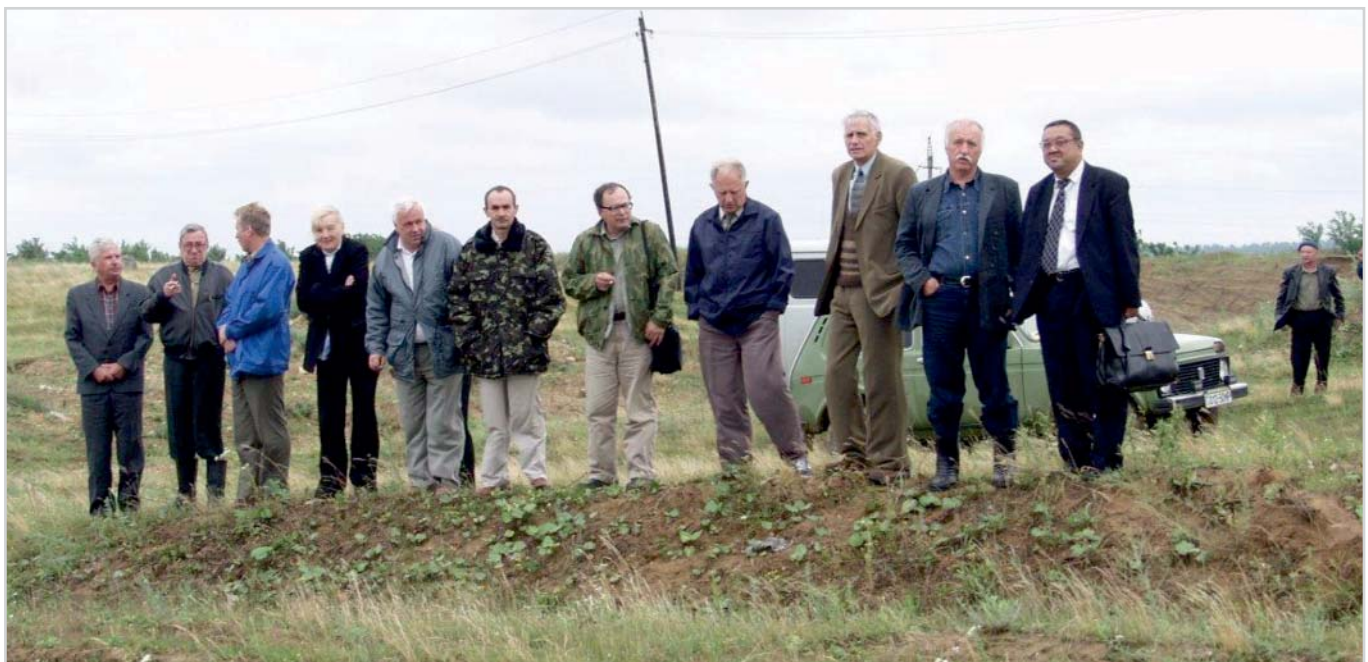
Рис. 3. Группа специалистов на натурном обследовании территории ГАЭС