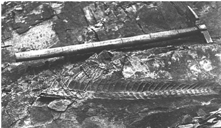
Рис. 2. Чорні сланці менілітової світи у відслоненні в руслі р. Рибниця

У 1990–1991 рр. за угодою між Івано-Франківським інститутом нафти і газу (ІФНГ) та Французьким інститутом нафти в Карпатському регіоні проводились науководослідні роботи з виявлення можливих нафтопродукуючих порід, тобто бітумінозних товщ, із застосуванням унікальної на той час експериментальної пересувної геохімічної станції ROCK-AVALE [15]. Результати цих робіт дозволили зробити висновки, що до нафтопродукуючих порід у геосинклінальній частині Карпатського регіону (Внутрішня зона Передкарпатського прогину та Скибова зона Карпат) можуть бути віднесені товщі менілітової світи олігоцену (вміст органічної речовини 30%), чорні аргіліти і сланці спаської і шепітської світ нижньої крейди, а в платформній частині регіону (Зовнішня зона Передкарпатського прогину і прилеглі площі західної окраїни Волино-Подільської плити) газонафтопродукуючими породами можуть бути породи силуру та верхньої крейди. В літологічному відношенні бітумінозні породи вказаних стратиграфічних підрозділів представлені сланцюватими темними і чорними аргілітами та сланцями. Вміст органічної речовини в породах спаської і шепітської світ коливається від 1 до 7% від об'єму кожного досліджуваного зразка по-