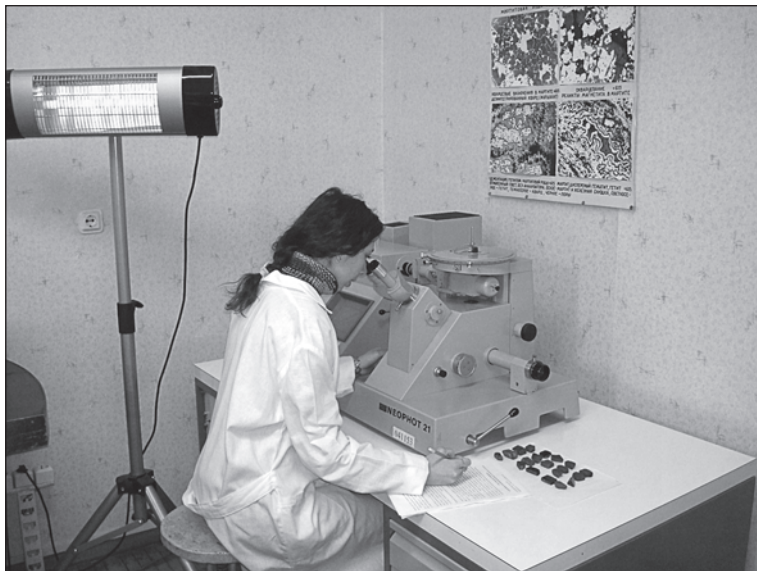
Рис. 2. Вивчення полірованих шліфів у відбитому світлі на мікроскопі Neophot 21