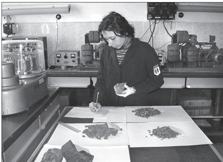
Рис. 1. Рудорозбирання проби вихідної руди у вузьких класах крупності

Підготовку шліфів і деяких препаратів здійснюють у шліфувальній майстерні інституту, яка оснащена шліфувальним і каменерізним станками, мікроскопами і необхідними матеріалами. Нижче коротко схарактеризовані порядок і методики, які застосовують на різних етапах мінералогічних досліджень.