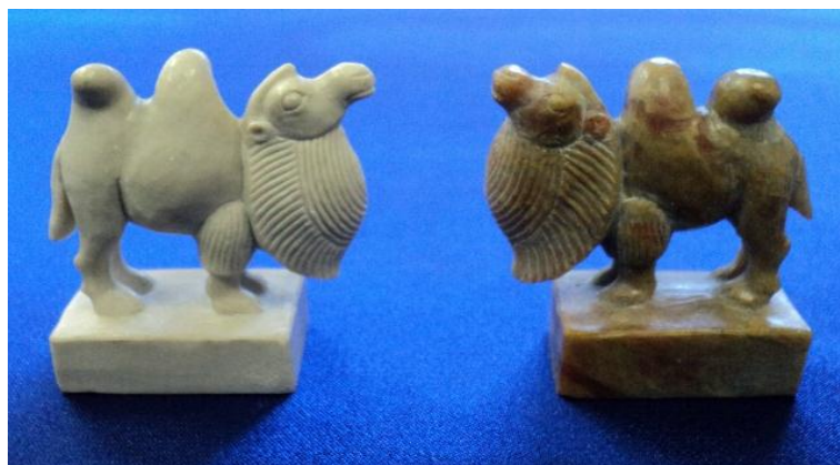
Рис. 5. Верблюды. Агальматолитовые шахматы. Мастер Хертек А. Ч.

Места фигурок слонов на игровой доске в тувинских шахматах занимают фигурки верблюдов («тевелер», рис. 5).