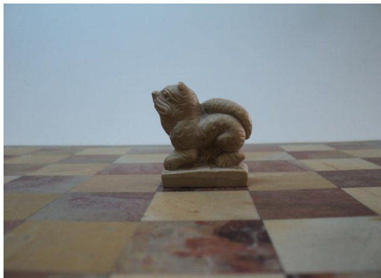
Рис. 3. Тигр. Агальматолитовые шахматы. Мастер Тойбухаа Х. К.

В некоторых тувинских шахматах ферзи вырезаны в виде медведя («адыг»), птицы Гаруды («Хаан-Херети», рис. 4).