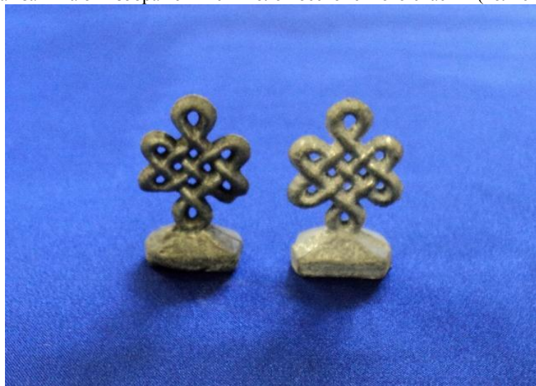
Рис. 9. Олчей удазыны. Дюралюминиевые шахматы. Мастер Салчак Р. К.

Фигурки птицы Гаруды или драконов, в тувинских шахматах исключение из правил, нежели чем традиция. Под влиянием буддийского искусства Тибета и Монголии, обычно угловые клетки на игровой доске тувинских шахмат занимают изображения символов бесконечного счастья («олчей удазыны», рис. 9).