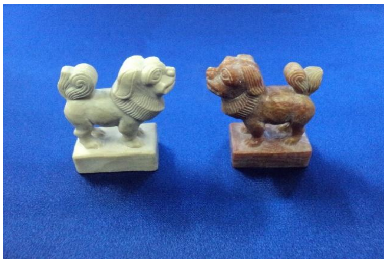
Рис. 2. Львы белой и черной сторон. Агальматолитовые шахматы. Мастер Хертек А. Ч.

Ферзь (по тув. «мерзе»), чаще всего изображается в образе хищных животных из семейства кошачьих – льва («арзылан», рис. 2),