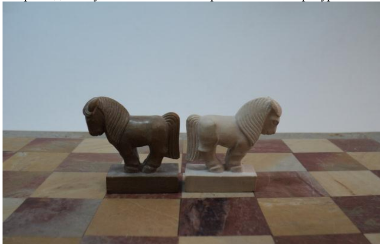
Рис. 6. Кони. Агальматолитовые шахматы. Мастер Тойбу-Хаа Ю. С.

Вслед за фигурками верблюдов в тувинских шахматах располагаются фигурки коней («аьттар», рис. 6),