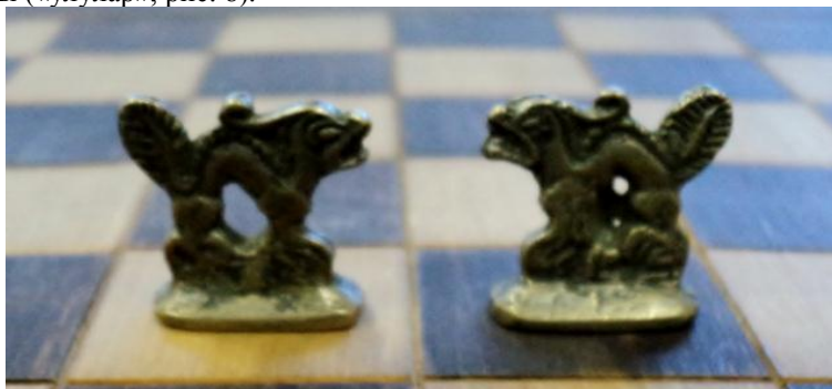
Рис. 8. Драконы. Бронзовые шахматы. Работа неизвестного мастера, XIX в.

Очевидно, что птицы-рух, упомянутые как крайние фигуры на игровой доске в поэме «Гав и Талханд (рассказ о происхождении шахмат)», присутствуют в некоторых тувинских шахматах как птицы Гаруды: