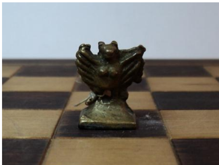
Рис. 4. Хаан-Херети. Бронзовые шахматы. Мастер Сарыг-Дарган.

В некоторых тувинских шахматах ферзи вырезаны в виде медведя («адыг»), птицы Гаруды («Хаан-Херети», рис. 4).