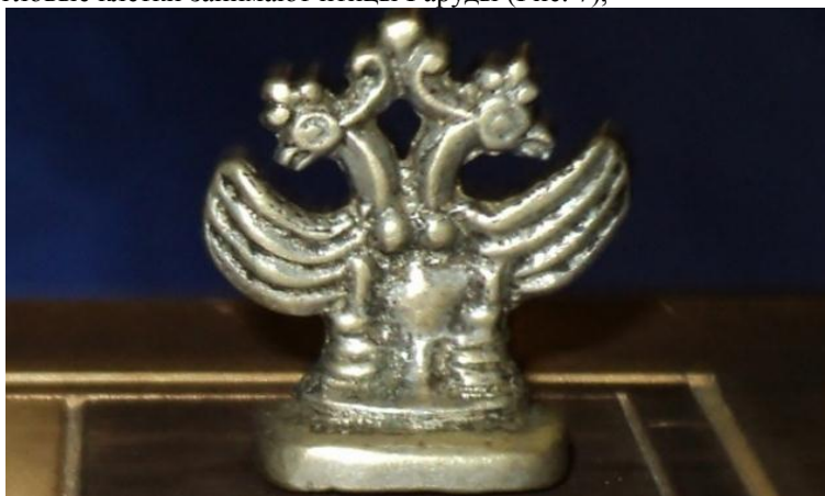
Рис. 7. Хаан-Херети. Бронзовые шахматы. Работа неизвестного мастера XIX в.

а самые крайние, угловые клетки занимают птицы Гаруды (Рис. 7),