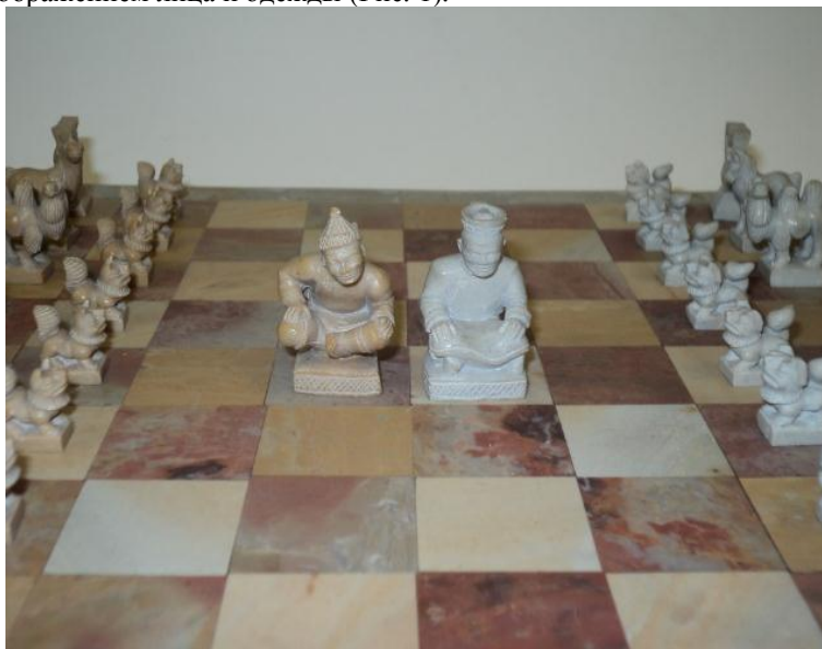
Рис. 1. Нояны. Агальматолитовые шахматы. Мастер Дойбухаа Д. Х.

Короли в тувинских шахматах чаще всего изображаются в виде хана или нояна (в пер. с монг. «князь»). Эти главные фигуры шахматной игры в работах тувинских мастеров нередко различаются друг от друга не только цветом, но и изображением лица и одежды (Рис. 1).