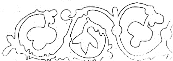
Рис. 3. Мотив стилизованной виноградной лозы в росписи храма «Донаторов». Схема росписи по О.И. Домбровскому

Если изображения лозы, листьев, гроздей винограда в античной мифологии были связаны с культом Диониса, то в греческом христианском искусстве изображение лозы и винограда отождествлялось с Христом и Церковью (например, растительные орнаменты храма «Донаторов» – Рис. 3).