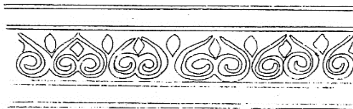
Рис. 1. Геометризованный растительный орнамент в храме «Донаторов». Схема росписи по О.И. Домбровскому

небесного или рая, в котором пребывал благочестивый христианин после смерти. А частые изображения цветка розы, вероятно, отражали представление о том, что в раю праведники проводят жизнь в тени розовых деревьев.