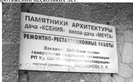
Илл. 5.

После национализации здание в течение некоторого времени было корпусом противотуберкулёзного санатория «Красный мак». Внутренние помещения подверглись значительной перепланировке. Затем в течение долгого времени вилла-дача оставалась заброшенной, на данный момент она обнесена забором и ожидает реставрации уже на протяжении нескольких лет.