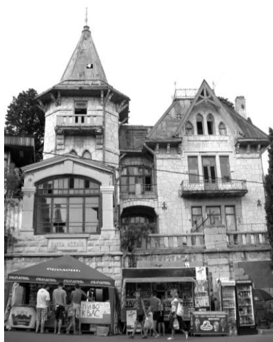
Илл. 2. Вилла «Ксения».

Здания усадеб возводились как архитекторами, чьи имена до нас не дошли, так и известными зодчими. Среди последних – Николай Петрович Краснов, автор Ливадийского дворца, здания банка Общества взаимного кредита в Симферополе и множества частных домов на южном побережье Крыма. В стиле так называемого северного модерна была возведена вилла «Ксения» в Симеизе (илл. 2), дворец «Дюльбер» в Мисхоре – в мавританском стиле.