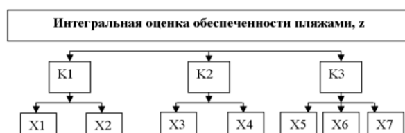
Рис. 1. Иерархическая структура системы показателей оценки пляжа.