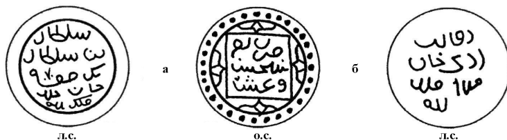
Рис. 5. Серебряные монеты (денги), чеканенные без указания монетного двора с датой прописью 825 г. х. (1421–1422 гг.), имеющие общий штемпель реверса и именами Бек-Суфи и Девлет-Берди на аверсе.