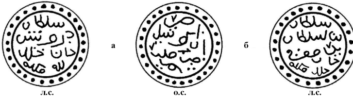
Рис. 2. Серебряные монеты (денги), чеканенные в городе Крым, без даты, имеющие общий штемпель реверса с именем Эдигея и имена ханов Дервиша и Бек-Суфи на аверсе.