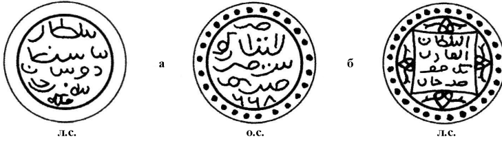
Рис. 1. Серебряные монеты (денги), чеканенные в городе Крым, имеющие дату 822 год хиджры (далее – г. х.) (1419–1420 гг.), общий тип реверса с именем Эдигея и имена ханов Дервиша и Бек-Суфи на аверсе.