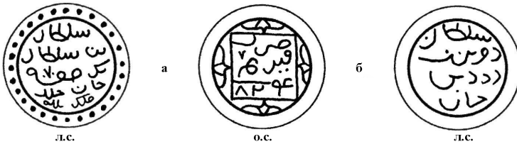
Рис. 3. Серебряные монеты (денги), чеканенные в городе Крым, имеющие общий тип реверса с датой 824 г. х. (1421 г.) с именами Бек-Суфи и Девлет-Берди на аверсе.