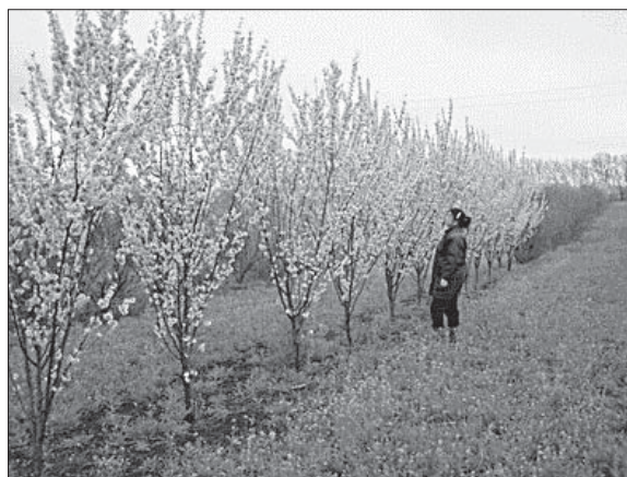
Рис. 1. Дерева сорту 'Vesnjancka'

Висока декоративність луїзеанії зумовлена рясним цвітінням, яке триває залежно