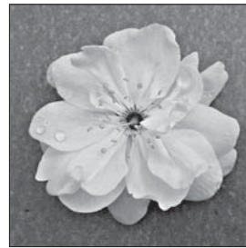
Рис. 3. Квітка сорту 'Snigy Uimury'

Колір пелюсток варіює від світло-рожевого до рожевого й темно-рожевого. Під час цвітіння спостерігається вигорання кольору й освітлення пелюсток.