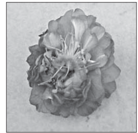
Рис. 4. Квітка сорту 'Lena' з кількома плодолистиками