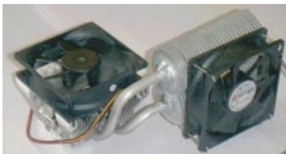
Рис. 2. Охлаждающее устройство на двух тепловых трубах с пластинчатым оребрением

Общий вид исследованных охлаждающих устройств, разработанных в КПИ, приведен на рис. 2, 3.