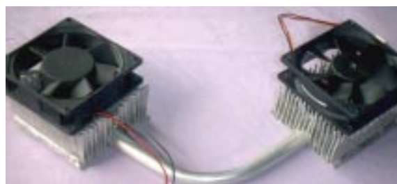
Рис. 3. Охлаждающее устройство на одной тепловой трубе с пластинчато-разрезным оребрением [5]

Для обдува теплоотдающих поверхностей применялись два малогабаритных вентилятора типа TFD-8025M12B, являющихся составной частью фирменного кулера Titan. Габаритные размеры осевого вентилятора 80×80×25 мм, частота вращения 2000 об/мин (RPM) при токе питания электродвигателя 0,11 А, шумовые характеристики не выше 30 дБ.