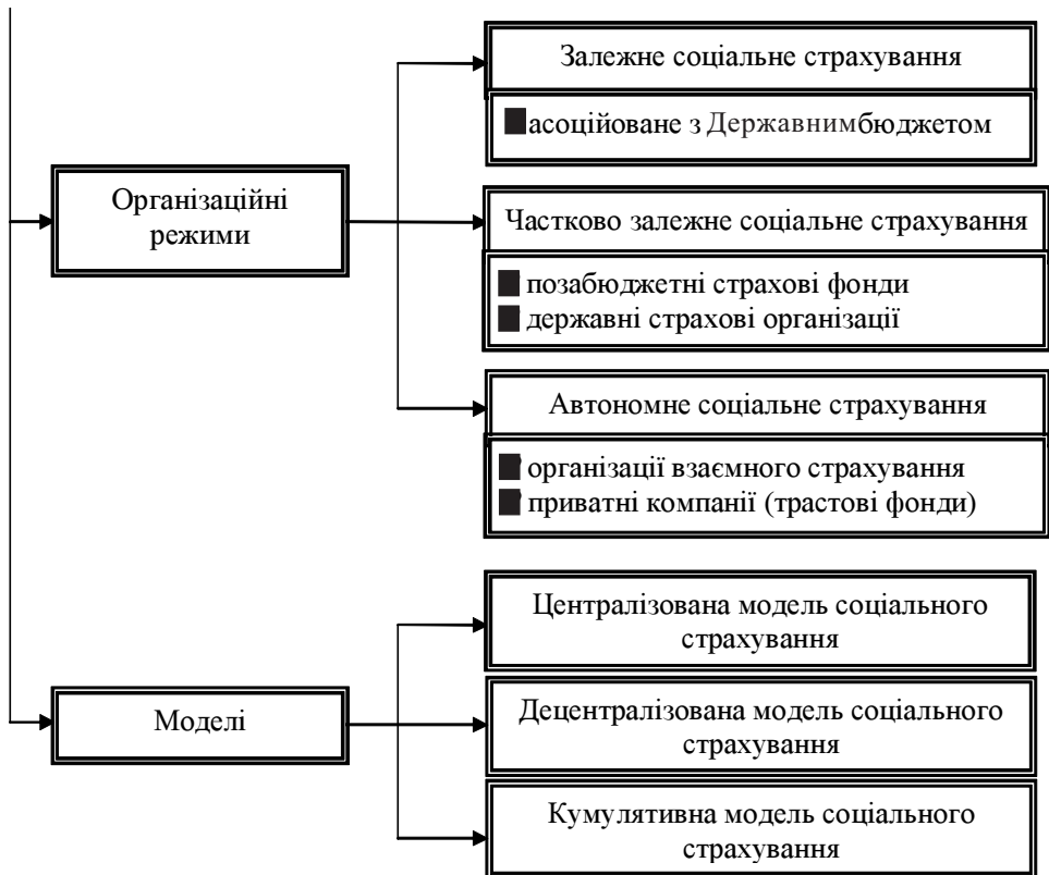
Рис.4. Організаційні форми соціального страхування у світовій практиці

У таблиці 1 наведено основні відмінності державного і колективного соціального страхування. І хоча мета і завдання обох форм соціального страхування в принципі збігаються, колективне соціальне страхування має значно вужчий об'єкт, який обмежується трудовим колективом, профспілкою, галуззю чи регіоном.