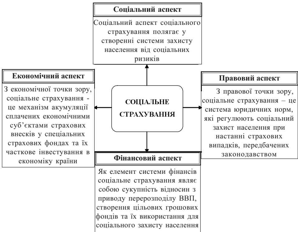
Рис.1. Окремі аспекти соціального страхування

Розкриваючи сутність соціального страхування, необхідно враховувати різні аспекти даної категорії: соціальний, економічний, правовий та фінансовий (рис.1).