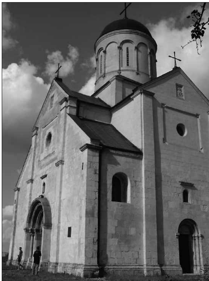
Церква св.Пантелеймона (бл.1200 р.; с.Шевченкове Залуквянської сільської ради Галицького р-ну Івано-Франківської обл.)

1 Харди Ї. Наследници Кијева: Између краљевска круне и татарског јарма. Студија о државно-правном положају Галичке и Галичко-Волинска княжевина до 1264 година. – Нови Сад, 2002. – С.90–103; Прицак О. Коли і ким було написано «Слово о полку Ігоревім». – К., 2008. – С.150; Майоров А.В. Из истории внешней политики Галицко-Волынской Руси времён Романа Мстиславича // Древняя Русь: Вопросы медиевистики. – Москва, 2008. – №4 (34). – С.78–96; Его же. Поход Романа Мстиславича 1205 года: в Саксонию или в Польшу? // Вопросы истории. – 2008. – №11. – С.36–48; Его же. Международное положение Галицко-Волынского княжества в начале XIII в. Роман Мстиславич и Штауфены // Доба короля Данила в науці, мистецтві, літературі. – Л., 2008. – С.120–127; Майоров О.В. Зовнішня політика Галицько-Волинської Русі часів Четвертого хрестового походу: стосунки з Німеччиною, Візантією та Польщею // Ruthenica. – К., 2008. – Вип.7. – С.105–129 та ін.