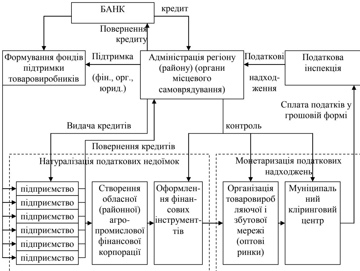
Рис. 2. Схема взаємодії банку й адміністрацій регіонів (районів) при кредитно-фінансовій підтримці сільгосптоваровиробників і підприємств харчової промисловості в ситуації "розв'язки" податкових недоїмок.

Що стосується технологій взаємодії банку й адміністрації регіонів або районів у сфері підтримки харчових товаровиробників при ситуації "розширки" поточних неплатежів у бюджет, натуралізації податкових недоїмок і їх наступної монетаризації, доцільно створити кліринговий центр і муніципальне підприємство, що забезпечує у взаємодії з товаровиробниками-платниками податків натуралізацію недоїмок і їх денатуралізацію (метаморфозу вартісних форм податкових зборів: товарної і грошової) з використанням фінансових інструментів: боргового податкового сертифіката і складських свідчень. Ця схема може бути представлена в наступному вигляді (рис. 2.).