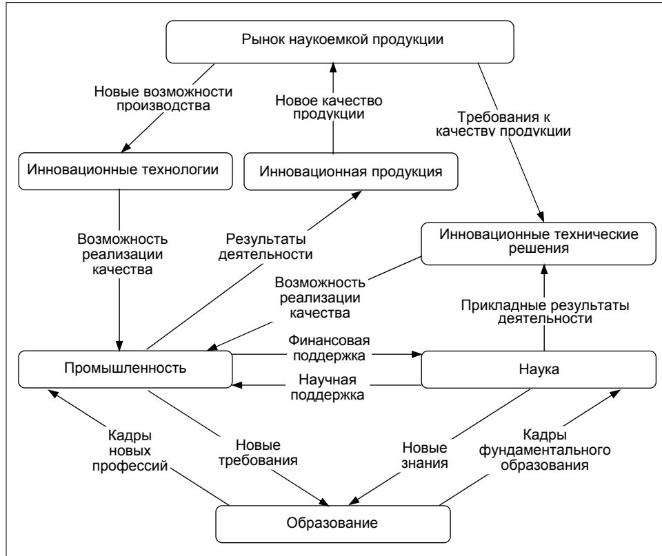
Рис. 1. Структура системных взаимосвязей субъектов инновационной деятельности

Другая модель (рис. 2) представляет собой иерархическую организационную структуру управления инновационной деятельностью в масштабах страны в реальных условиях высокого динамизма современного мирового рынка, который определяется динамикой электронной коммерции и бизнесом в высоком темпе [8, 9].