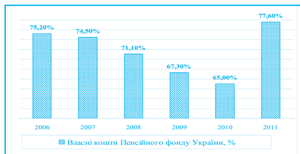
Рис. 2. Власні доходи Пенсійного фонду України у 2006–2011 рр., %

У структурі доходів бюджету Пенсійного фонду частка власних коштів упродовж 2006–2010 рр. зменшилася від 75,2% до 65,0%; і лише у 2011 р. вона зросла до 77,6%, що відображено на рис. 2.