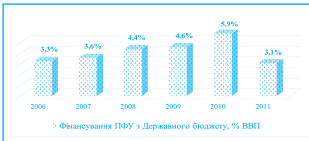
Рис. 3. Видатки на фінансування Пенсійного фонду України з Державного бюджету в 2006–2011 рр., % ВВП

раїни «Про загальнообов'язкове державне пенсійне страхування», тобто в мініальному, такий дефіцит, відповідно до ст. 113 цього закону, покривається за рахунок коштів державного бюджету [1]. У 2006–2010 рр. видатки на фінансування дефіциту коштів ПФУ з державного бюджету неухильно зростали, досягнувши у 2010 р. позначки 5,9% ВВП. Відносне скорочення цього показника до 3,1% ВВП відбулося лише у 2011 р., що графічно зображено на рис. 3 [2; 10].