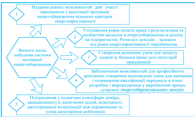
Рис. 1. Основні сучасні вимоги до побудови системи мотивації трудової діяльності з позицій енергозбереження на гірничозбагачувальних підприємствах