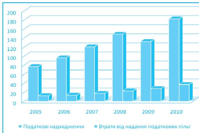
Рис. 3. Динаміка втрат від надання податкових пільг та податкових надходжень, 2005-2010 рр., млрд. грн.