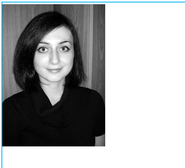
Рис. 3. Модель фінансового кластеру

На думку автора, способом вирішення вищеперерахованих проблем є створення на території західних областей фінансового кластеру, який за умов співробітництва різних фінансових установ і промислових підприємств сприятиме позитивному ефекту для всіх учасників. Отже, формування фінансового кластеру передбачатиме об'єднання не тільки різнотипових фінансових установ (банків, інвестиційних, трастових фондів тощо), а й підприємств, які матимуть змогу створювати і виробляти конкурентоспроможну, інноваційну продукцію. На підставі проведеного аналізу автором запропоновано власну модель фінансового кластеру, яка базується на засадах консолідації та інтеграції (рис. 3).