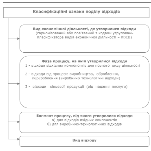
Рис. 3. Класифікація видів відходів згідно з Класифікатором відходів ДК 005-96

Через відсутність обов'язкових норм щодо первинного сортування на полігононі та сміттєзвалища потрапляє значна частина відходів, які мають високу ресурсно-цінну компоненту і підлягають переробці, що значно