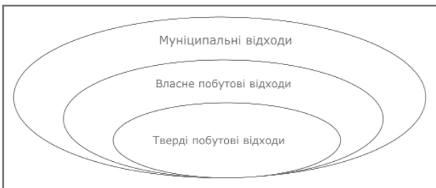
Рис. 2. Склад відходів

емств) і не використовуються за місцем їх накопичення» [1]. Побутові відходи (або відходи побуту) можна класифікувати по-різному, залежно від класифікаційної ознаки. Оскільки в Україні нині не існує стандартів, які б регулювали механізми поводження з відходами і давали чіткі трактування специфічної термінології та понять у цій сфері, поряд із терміном «побутові відходи» вживається поняття «муніципальні відходи», яке запозичене у розвинених країнах Заходу. Історично «муніципальними відходами» називали відходи, похованням яких займалася міська влада. Проте у зарубіжних країнах значна кількість побутових відходів збирається і переробляється не міськими комунальними службами, а приватними підприємствами. У міру зростання кількості та різноманіття відходів, ускладнення відносин, пов'язаних з їх утилізацією вироблені різні класифікації і визначені типи відходів. Деякі з них були покладені в основу національних законів, регламентують порядок поводження з різними типами відходів. Муніципальні відходи мають різне походження (саме тому термін «муніципальні відходи» поняття більш широке, ніж термін «побутові відходи»). Перші, крім відходів, вироблених населенням, включають також ті, що вироблені ресторанами, торговими підприємствами, установами, муніципальними службами. Однак і муніципальні, і власне побутові відходи об'єднують те, що відповідальність за їх утилізацію покладається на міську владу. Розподіл різних типів відходів наведено на рис. 2 .