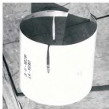
Рис. 2. Внешний вид одного из разрезанных кожухов обтекателя боевой части 9Е-1028.