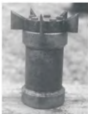
Рис. 1. Режущий инструмент для разрезания тонкостенных алюминиевых корпусов боевых частей.

В данной работе приведены результаты одного из этапов отработки методики, а именно: результаты определения динамического усилия, необходимого для разрезания кожухов обтекателей боевых частей типа 9Е-1028. Собственно, кожух представляет собой цилиндр из алюминиевого сплава АМг6 длиной 173 мм внешним диаметром 170 мм и толщиной стенки 1,0 мм. В экспериментах использовали кожухи, полученные при предшествующей разборке боевых частей. В установочные гнезда барабана вставляли по пять кожухов таким образом, чтобы их разрезание проводилось в местах, примерно диаметрально противоположных предшествующим прорезам. Для разгона ножа использовали ВВ НИЛ-2 с плотностью наполнения 0,41 \text{ г/см}^3 . Подрыв заряда ВВ производили с помощью капсуля-детонатора АТЭД 4.000.8, устанавливаемого непосредственно во взрывной камере. В каждом эксперименте двумя электромагнитными датчиками измеряли скорость ножа при его подходе к барабану. После окончания эксперимента визуально наблюдали вид разреза и измеряли его длину для каждого из кожухов.