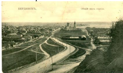
Общий вид г. Бердянска на почтовой открытке начала XX в.

Так протекала жизнь нашего героя до его судьбоносного назначения на новый высокий пост.