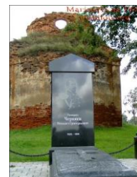
Памятник на могиле генерал-лейтенанта М.Г. Черняева