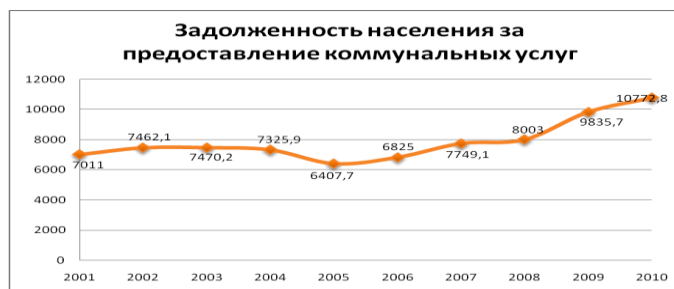
Рис. 4. Задолженность населения за предоставление коммунальных услуг (млн. грн.), 2001-2010 гг.

Недостаточная комфортность, низкая энергоэффективность жилых домов первых массовых серий, их значительный физический и моральный износ требуют решения проблемы капитального ремонта (реконструкции) жилья с применением современных энергосберегающих технологий, материалов и оборудования.