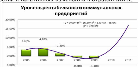
Рис. 3. Уровень рентабельности предприятий, осуществляющих деятельность в сфере предоставления коммунальных услуг.

С 2006 г. происходит снижение рентабельности предприятий жилищно-коммунального хозяйства, в 2009 г. она составила -1,1% (рис. 3). Проведенный автором регрессионный анализ спрогнозировал начало роста уровня рентабельности коммунальных предприятий после 2009 г. при отсутствии ухудшения общего состояния экономики государства и негативных изменений в отрасли ЖКХ.