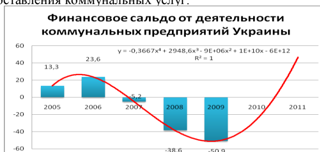
Рис. 1. Финансовое сальдо от деятельности коммунальных предприятий Украины, 2005-2009 гг., млрд. грн.

В период 2007-2009 гг. общее финансовое сальдо от деятельности коммунальных предприятий Украины является отрицательным (рис. 1), наблюдается тенденция роста убыточных коммунальных предприятий (рис. 5), что связано со сложной экономической ситуацией в Украине и моральным устареванием технического оснащения коммунальной отрасли, а также неэффективной политикой государства в сфере предоставления коммунальных услуг.