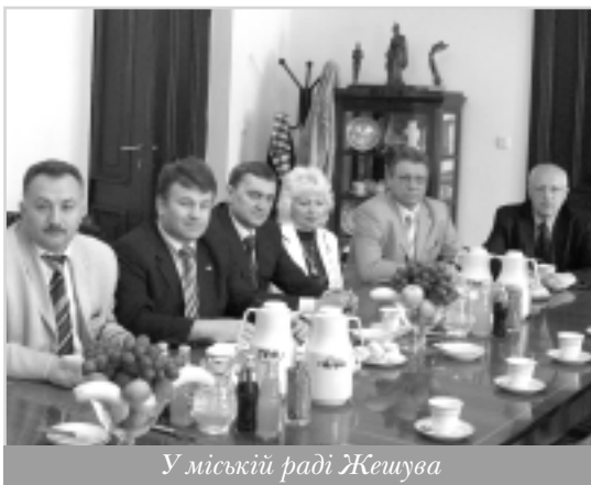
У міській раді Жешува

Жешув визнано другим містом у Польщі за якістю життя у 2009 році. Він реалізував проекти з підвищення якості питної води, реновації комунальних мереж і доріг, оснащення 7000 місць на «зелених» автостоянках, бере участь у спільних культурних та інфраструктурних проектах у рамках транскордонного співробітництва з українськими містами Львовом, Луцьком, Івано-Франківськом. Нині Жешув управляє проектами, які частково фінансуються з ЄС, на суму близько 483 млн. злотих. Термін їх завершення – 2013 рік.