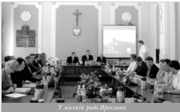
У міській раді Ярослава

Українці одержали можливість проконсультуватися із головою водного комунального господарства Жешува, відвідали підземну туристичну трасу під центральною площею міста, відчули вдале поєднання сучасних технологій і колориту старовинних підземних купецьких та ремісницьких підземних приміщень – крамниць, сховищ, майстерень.