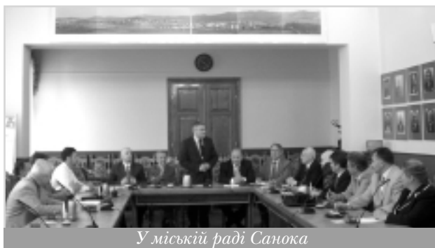
У міській раді Санокі

Цього дня українська делегація відвідала місто Саноk, де впродовж дня активно працювала разом із мером міста Войцехом Блехарчиком та його командою. В Санокі проживає 43 тис. людей, він є центром повіту (району) зі 100 тис. мешканців. Санок – місто з давньою історією та європейським сьогоденням. Ще у 16 столітті воно було центром Львівського воєводства Речі Посполитої, яке за своїми розмірами дорівнювало нинішньому великому Подкарпатському воєводству. Нині Санок – освітній центр зі своїм університетом, де навчається 3 500 студентів. У місті працює 3 000 суб'єктів господарської діяльності. Санок – привабливий пункт історичного та зеленого туризму і «ворота» в польські гори Бешчади.