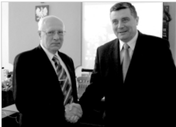
Мер Ярослава А. Вичавські (праворуч) та О. Соскін домовилися про довгострокову співпрацю

«ми створюємо місця для комфорту та безпеки наших жителів у часи великих катаклізмів і криз, у цьому наше завдання».