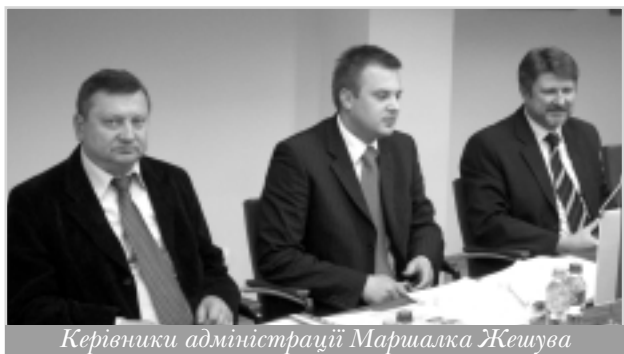
Керівники адміністрації Маршалка Жешува

Говорячи про переваги від вступу до ЄС для Подкарпатського воєводства, де проживає 2,1 млн. поляків, пан віце-маршалек наголосив на реалізації великих інфраструктурних проєктів, будівництві супер-сучасних доріг і капітальному ремонті вже існуючих автошляхів. Протягом 2007–2013 рр. до регіону має надійти 1,3 млрд. євро інвестицій від Єврокомісії, що покривають 20–80% вартості проєктів, які нині реалізуються. Сьогодні в регіональній адміністрації воєводства налічується 729 людей, і 284 з них працюють винятково за проєктами ЄС. Саме тут безпосередньо керують регіональною програмою операційних фондів Євросоюзу. Ідеться про кошти, які надходять на рівень кожного регіону Польщі