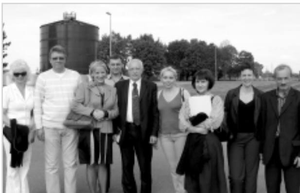
Українська делегація відвідала міську водоочисну систему Пшемишля

В останній день візиту до Польщі українську делегацію приймали в місті Пшемишль. Українців привітав заступник мера міста, свої доповіді презентували керівники відділів культури і туризму, європейських фондів та міжнародної співпраці. Після цього відбулися відвідини двох комунальних об'єктів, модернізованих за проектами ЄС, а саме – підприємства зі збору та захо-