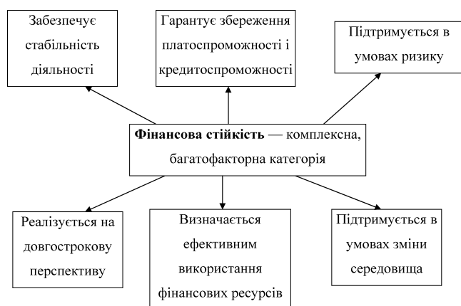
Рис. 1. Основні ознаки фінансової стійкості підприємства

Наступною ознакою фінансової стійкості, яка перетинається з попередньою, виділено вміння підтримувати стабільність в умовах зміни внутрішнього і зовнішнього середовища [5]. Вкрай важливим є адаптація до негативної дії факторів у динамічному оточенні, вміння вчасно їх прогнозувати, пристосовуватися до нових господарських реалій, особливо в умовах кризи (економічної, фінансової, політичної тощо).