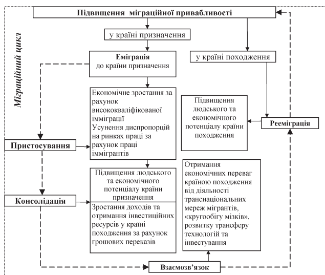
Рис. 3. Ефекти від міграції в країні в залежності від її ролі та стадії міграційного циклу, що визначаються міграційною привабливістю

США (71 тис. осіб у 2010 році) та Японії (66 тис. осіб), а також переселенців з Південної Кореї (121 тис. осіб) та африканських країн (близько 100 тис. осіб) [11].