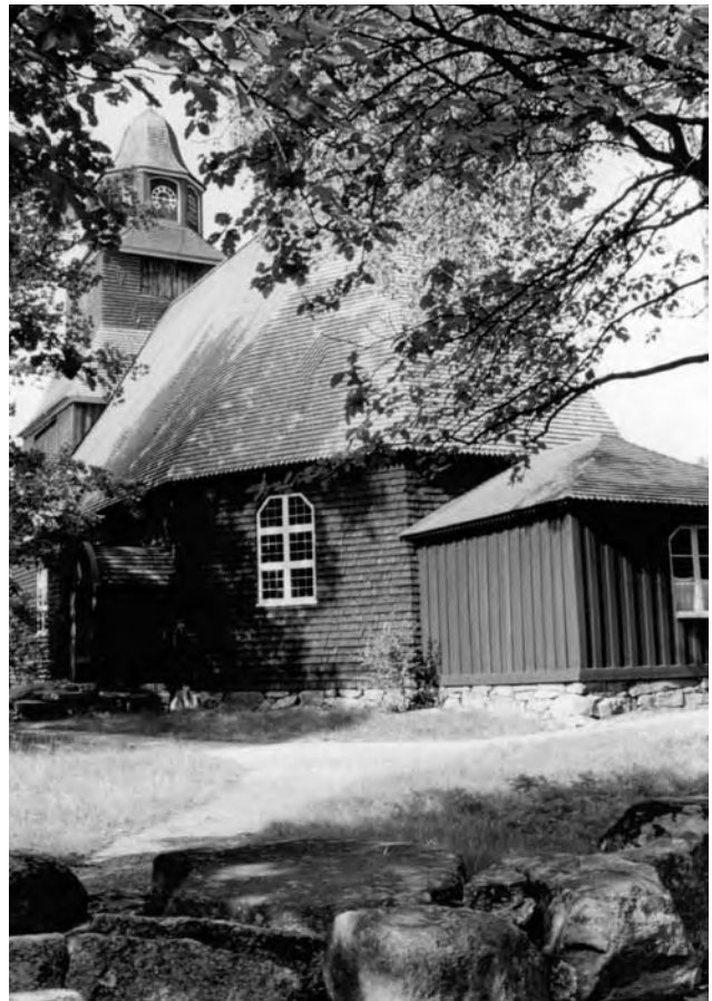
Храм в Сеглорі (Seglora), нині у скансені м. Стокгольм, 1729–1730. Швеція (фото автора, 1994)