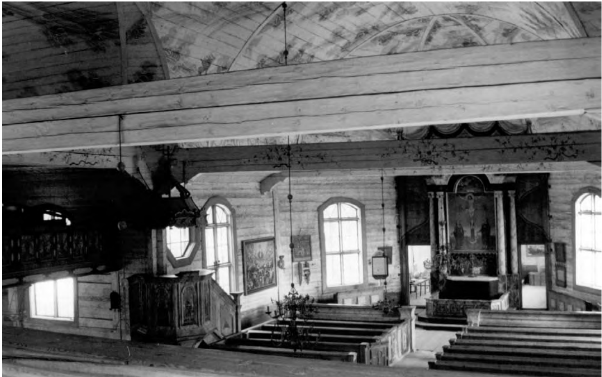
Інтер'єр храму в Кеуруу (Keuruu), 1756–1759. Фінляндія (фото автора, 1993)