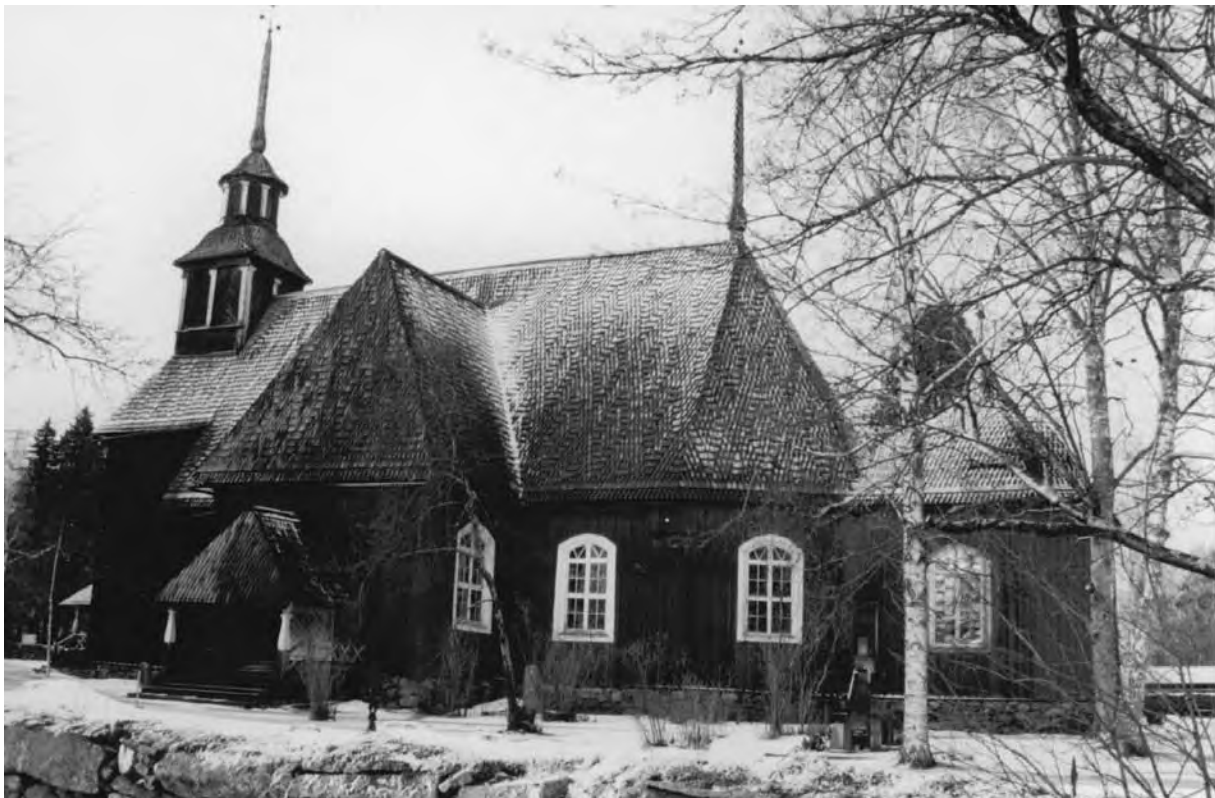
Храм в Кеуруу (Keuruu), 1756–1759, будівничий Антті Гакола. Фінляндія (фото автора, 1993)