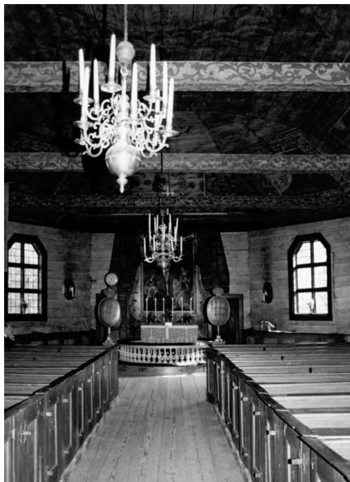
Интер'єр храму в Сеглорі (Seglora), нині в скансені м. Стокгольм, 1729–1730. Швеція (фото автора, 1994)