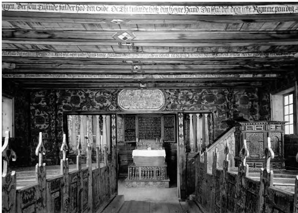
Интер'єр храму в Гаупне (Gaupne), 1647. Норвегія