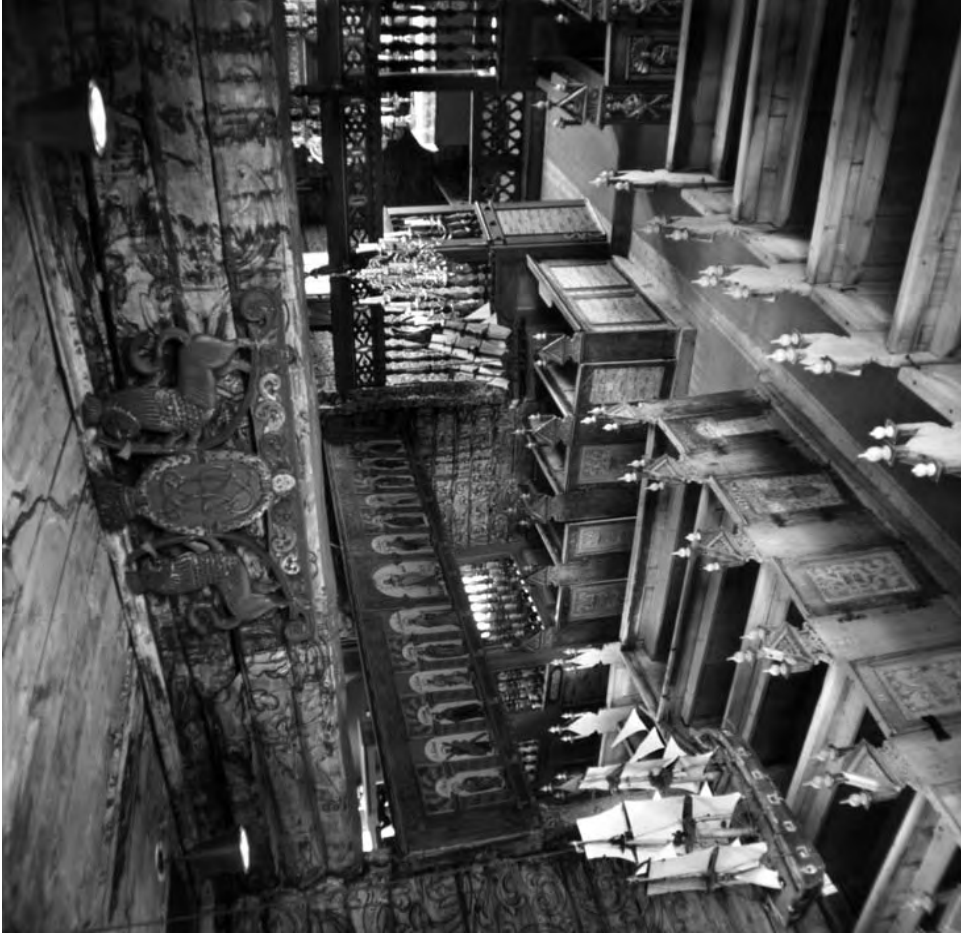
Інтер'єр храму в Квікне (Квікпе), 1654, оздоблення XVII–XVIII ст. Норвегія