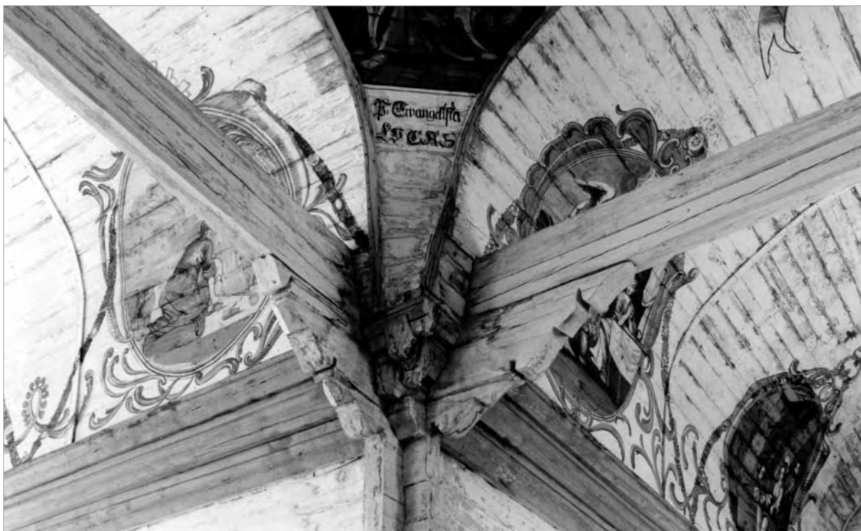
Наріжні балки й консолі нави і трансепта храму в Палтанемі (Paltaniemi), 1726, будівничий Йоган Кнубб. Фінляндія (фото автора, 1993)