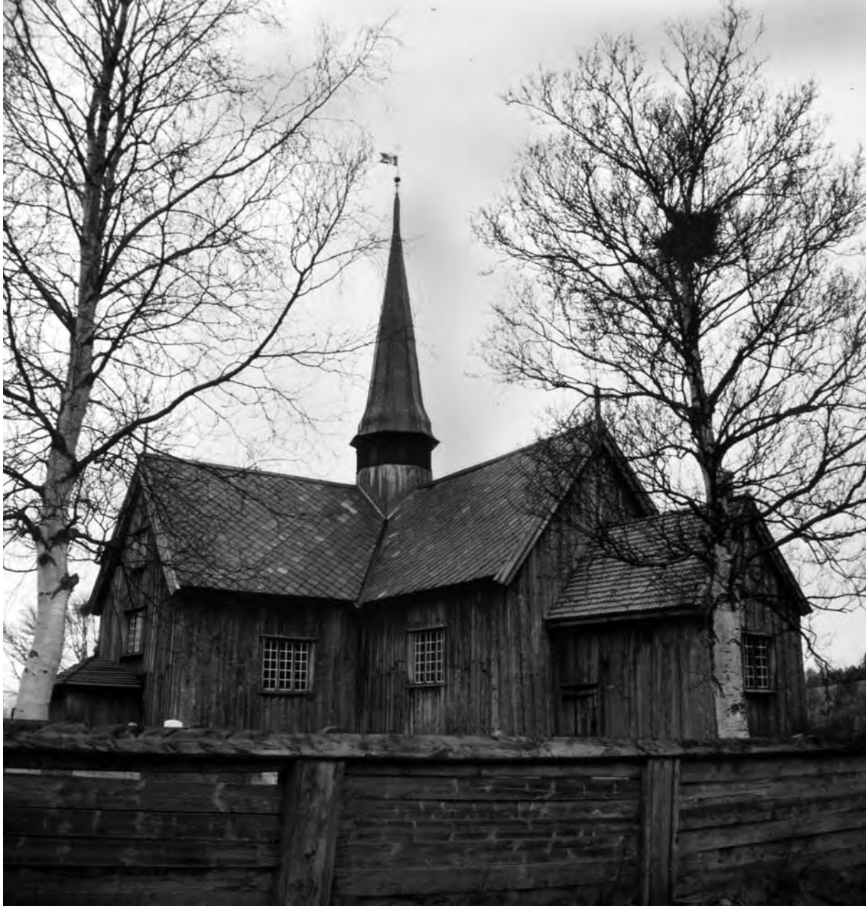
Храм у Інсеті (Inset), 1642. Норвегія (фото автора, 1990)