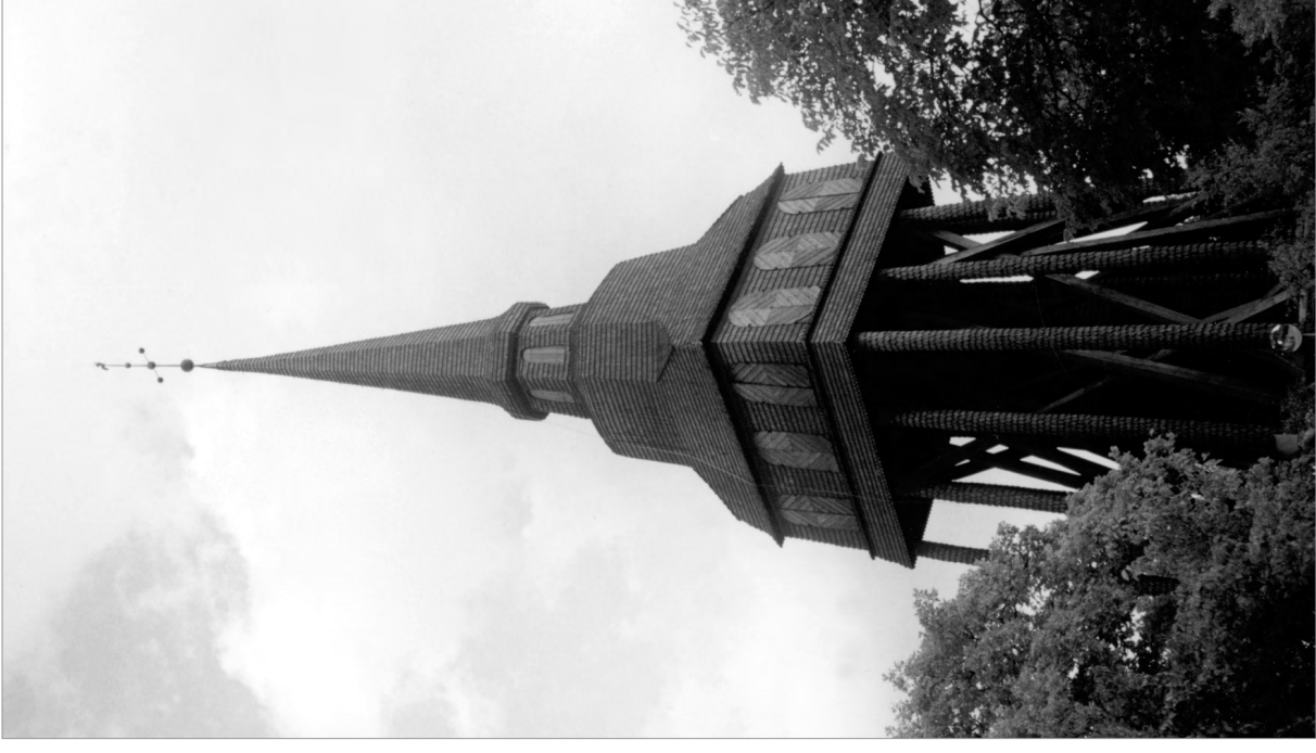
Дзвіниця з Галлестаду (Hallestad), нині в скансені м. Стокгольм, 1732–1733. Швеція