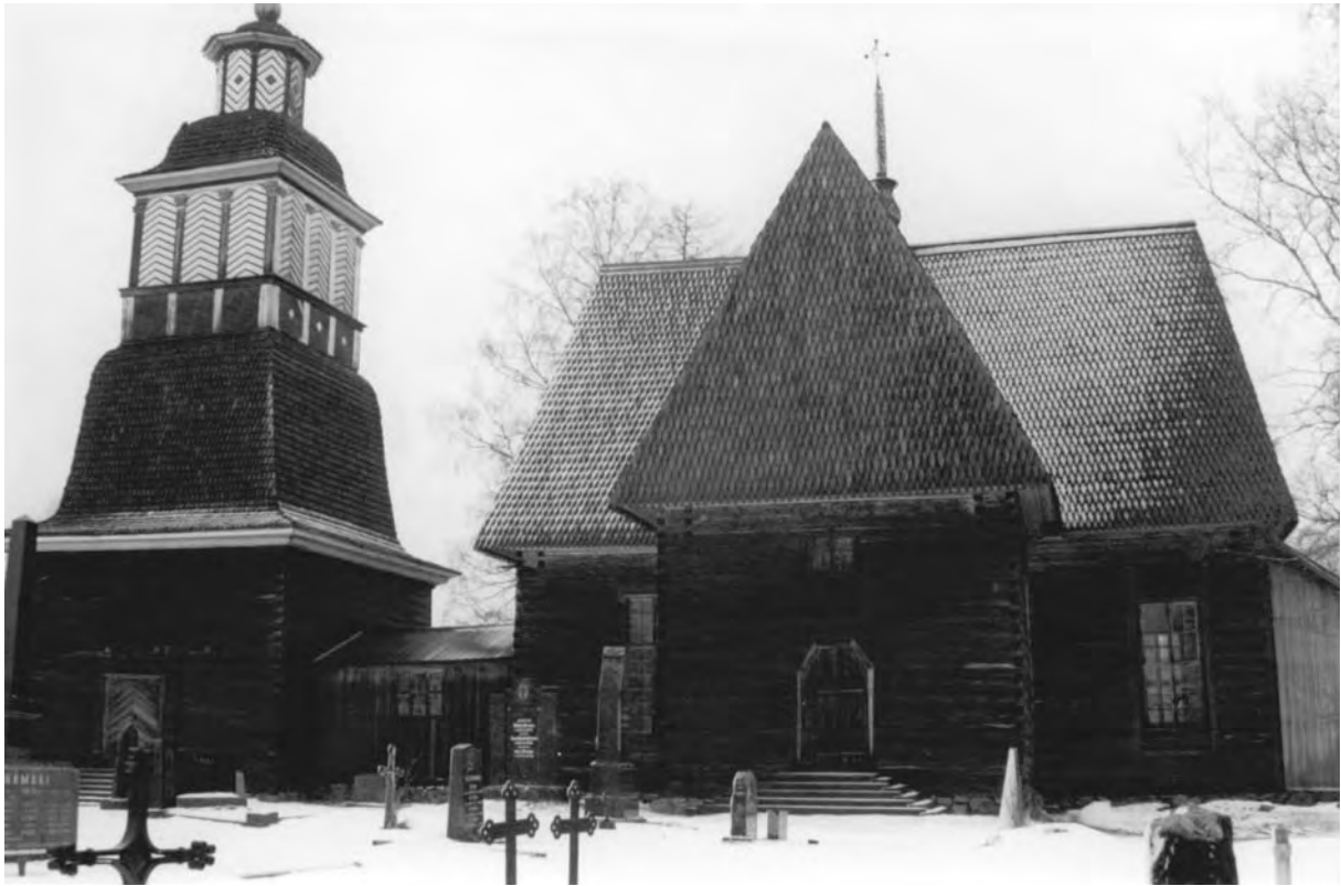
Храм в Петеевеси (Petäjävesi), 1763–1765, будівничий Якко Клеметінпоїка Леппенен; дзвіниця 1821, Фінляндія