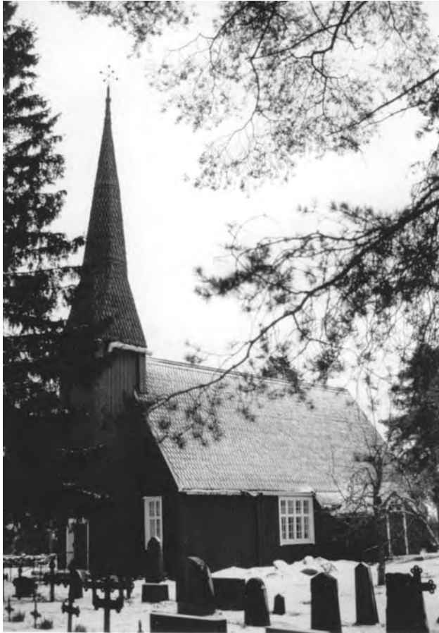
Храм в Кемпеле (Кетрепеле), 1688–1691. Фінляндія (1993)