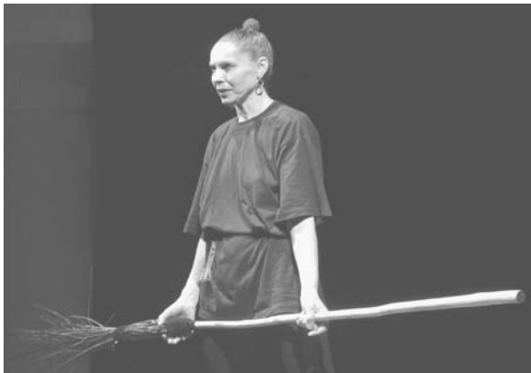
“Сон. Комедія” за Т. Шевченком (2003)

графією тут служать два пеньки і мітли (які діють у виставі за законом партнерського співіснування). “Предмет змінює функції і залежно від обставин розвитку сюжету трансформується через образний знак, художній символ у мистецький образ фатуму, містичного провидіння” 9 .