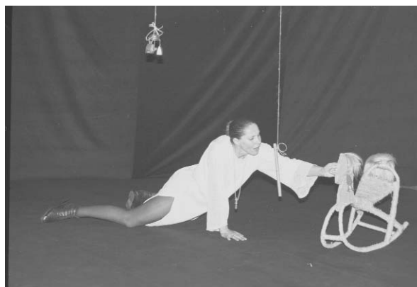
“Білі мотилі, плетені ланцюги” за В. Стефаніком (1997)

Символічними в “Театрі у кошику” є рукотворність тканин і декорацій. Часто тут використовують льон, плетиво, шнури. Багатогранність образного звучання речей (як от дзвіночки, сопілка, дрімба, іграшка коник-каталка, домоткане полотно на підлозі, сукня шита за бойківським кроєм) використано у виставі “Білі мотилі, плетені ланцюги” (художник Д. Зав'ялова). Знаковим також є художнє оформлення вистави “Украдене щастя”, що є яскравим прикладом модернізації української класики. Національний колорит присутній у всіх сферах вистави. Домінуючий колір – білий, що посилює образно-філософське звучання драми. Білий, як відомо з історії, був символом жалоби у бойків, у Китаї, в Іспанії (на Мавританському сході). Білий тут звучить як Небо і Цвіт, Кохання і Журба, Смерть і Життя. Біле по білому, лише подекуди вкраплення м'яких окремих блідо-трав'янистих зелених тонів (шинелі Михайла і Миколи). Біла полотняна білизна Анни покрита коричневою спідницею і сорочкою. У виставі є ще кошик-решето з “коралями” – “це коралі зі сну Анни, які матеріалізуються пізніше як кров, як сльози і як власне коралі” 5 .