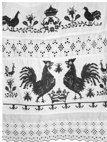
Вишитий рушник з орнітоморфним орнаментом. Вінниччина. 1920–1930. ННЛЕП ВДПУ

Одним з найпопулярніших мотивів вишивки Поділля є ромбо-меандричний орнамент, який застосовували як магичний загальний фон і як символ земної, рослинної родючості та добробуту. Чотири зімкнуті ромби, а також ромби з крапками утворюють ідеограму зораного й засіяного поля 18 .