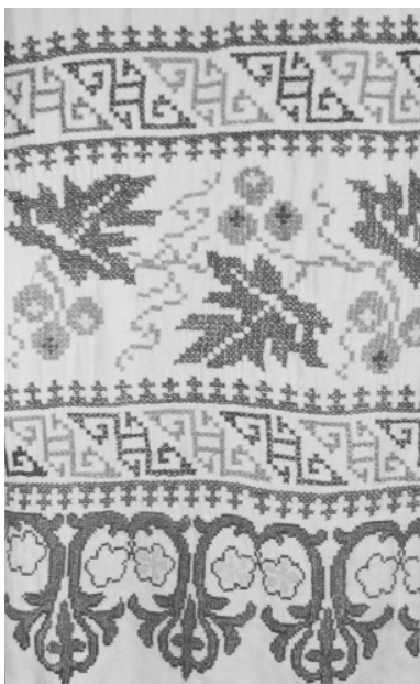
Вишитий рушник з фітоморфним орнаментом. с. Соколова Хмільницького р-ну Вінницької обл. 1920–1930. ННЛЕП ВДПУ

всю композицію, створює точний, безперервний ритм руху, підкорює собі будь-яке зображення. У свою чергу ця лінія поєднана з різними, часто складними, елементами. Лінія може бути прямою, ламаною, зигзагоподібною або меандричною. У геометричному орнаменті важко знайти початок, адже це безкінечний ланцюг елементів узору, що поєднуються, чергуються, взаємодоповнюються 14 . Наприклад, відомий ще з трипільської культури мотив «кривцівки», або «безконечник», — це нитка життя і вічність сонячного руху, поєднання життєдайної сонячної енергії із силою матері-землі 15 .