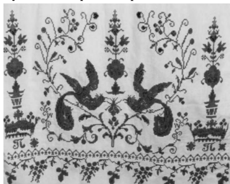
Вишитий рушник з орнітоморфним орнаментом. Вінниччина. 1950–1960. ННЛЕП ВДПУ

назовні відходять гачки, загнуті в одному напрямку: зліва направо і справа наліво 23 .