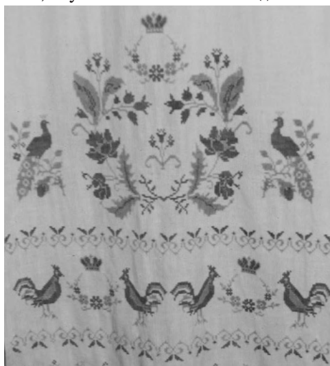
Вишитий рушник з орнітоморфним орнаментом. с. Лиса Гора Іллінецького р-ну Вінницької обл. 1940-ві роки. ННЛЕП ВДПУ

ючими геометричними рослинними мотивами — п'ятипелюстковими квітами-розетками. Пелюстки вишивали червоним кольором і обрамляли чорною штапівкою. Квіти розміщували рядками або в шаховому порядку. У східних районах подільського краю поширилася вишивка геометризованих рослинних мотивів червоним і чорним хрестиком, а також хрестиком і штапівкою. Неабияке декоративне навантаження несе біле тло тканини. Дрібненькі штапівкові стібки обрамляють провідні мотиви розеток-звезд, що стеляться в різних смугах. Це надає орнаменту витонченості, прозорості, а колориту — чорно-бровистості, яку особливо люблять подолянки 27 .