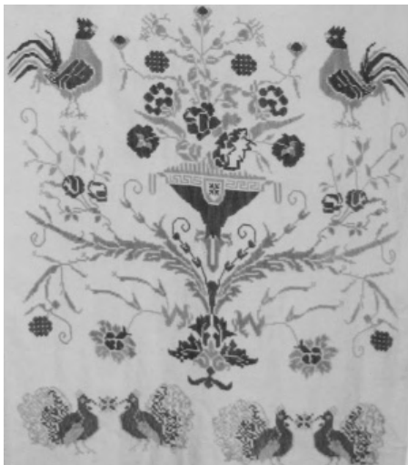
Вишитий рушник з орнітоморфним орнаментом. с. Райки Калинівського р-ну Вінницької обл. 1930–1940. ННЛЕП ВДПУ

варіантів ромба з гачками. Часто трапляються гребінцеві фігури, які іноді настільки густі, що залишається одна незашита нитка тла для того, аби весь узор не зливався. Доповненням до ромбоподібних фігур слугують «прямий» і «косий» хрестики, ламана лінія, різноманітні трикутнички 19 .