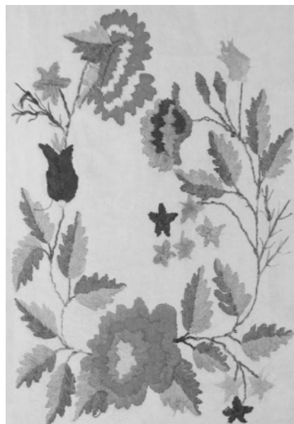
Вишитий рушник з фітоморфним орнаментом, призначений для короваю. с. Слобідка-Кельменецька Деражнянського р-ну Хмельницької обл. 1950–1960. ННЛЕ КІНУ

Мотиви української народної орнаментики здебільшого поділяють на геометричні (абстрактні), фітоморфні (рослинні), зооморфні (тваринні), орнітоморфні й антропоморфні 12 . До геометричних у свою чергу належать: найпростіші геометричні елементи (риски, смуги, крапки, цятки), елементарні гомогенні знаки з прадавньою семантикою (кола, ромби, спіралі тощо), композитні гомо- і гетерогенні знаки, скомпоновані за різними способами симетрії (дво- і трилисники, багатопроменеві зірки, розетки, хрести тощо), знакові та ізоморфні зображення живих істот, рослин, небесних тіл, міфологічно-фольклорних персонажів 13 .