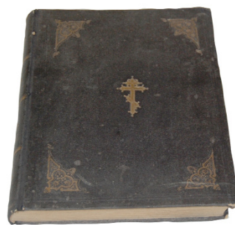
Псалтир (Львів, 1901). З фондів Музею української культури у Свиднику.