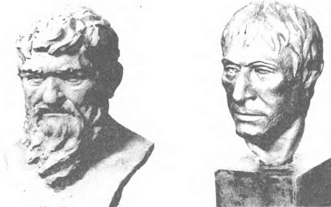
Рис. 5. 1) Чоловік із мезолітичного могильника Василівка III (скульптурна реконструкція Г. Лебединської); 2) Чоловік із мезолітичного могильника поблизу с. Волоське (скульптурна реконструкція Т. Сурніної)

ці-археологи відносять до культури Коморниця. Типологічно вона близька до культури Кудлаївка, пам'ятки якої локалізуються на Українському Поліссі. Обидві культури, межі між якими дуже умовні, належать до однієї і тієї ж історико-культурної спільноти — Дювенсі 22 .