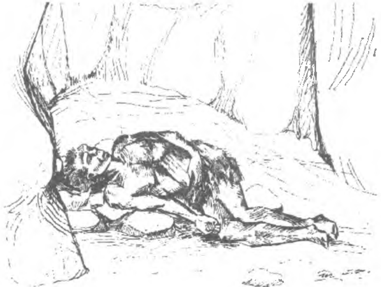
Рис. 2. Реконструкція посмертної пози «архаїчного сапієнса» із Петралони (за А. Пуляносом)