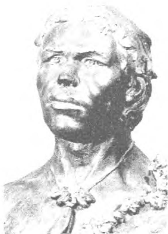
Рис. 4. Мисливець із гроту Кро-Маньйон (скульптурна реконструкція М. Герасимова)

Життєдіяльність європейських неантропів, основу якої складало полювання на великого звіря, проходила в умовах суворого клімату прильодовикової зони. У зв'язку з цим вони часто жили в печерах та гротах і споруджували штучні житла, які розрізнялись розмірами, формою, конструкцією. Переважали округлі споруди діаметром 5–6 м, що зовні нагадують яранги сучасних мешканців полярної зони. «Фундаментом» таких споруд слугували присипані землею черепи, лопатки і щелени;