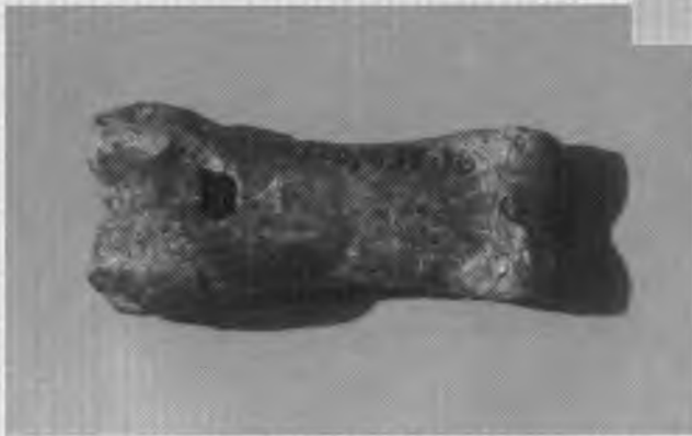
Музичний інструмент (?) із Мамонтової печери. Свисток (?)