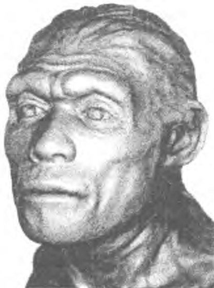
Рис. 1. «Архаїчний сапієнс» із Араго (скульптурна реконструкція Г. Лебединської)

Усі ці розрізнені знахідки мають одну спільну рису: мозаїчне переплетіння дуже архаїчних і більш сучасних ознак морфологічної будови,