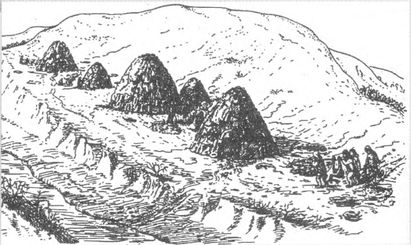
Загальний вигляд Мізинського верхньопалеолітичного поселення