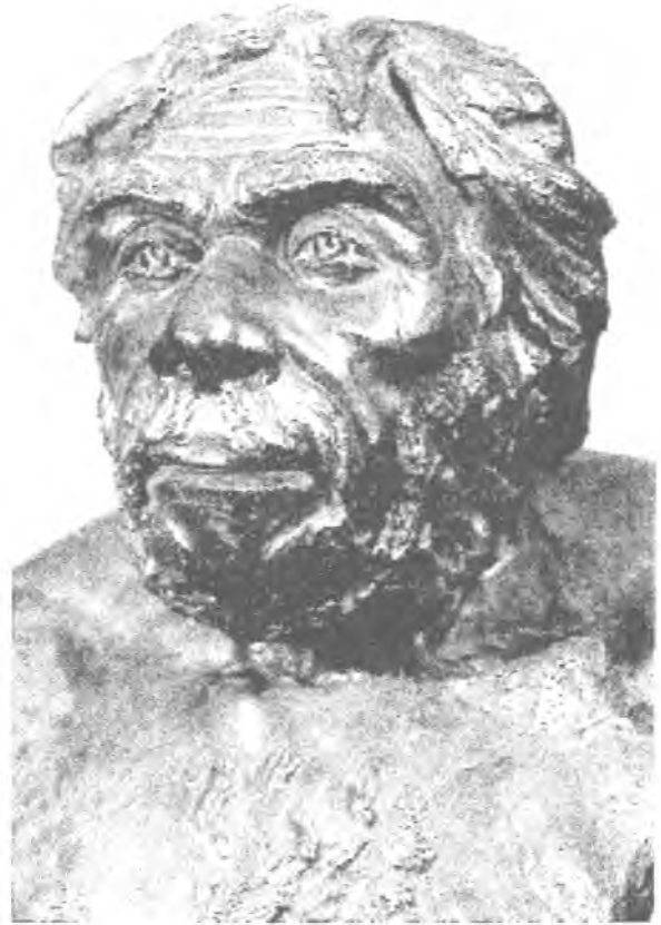
Рис. 3. Неандерталець із Ля Шапель-о-Сен (скульптурна реконструкція М. Герасимова)

Неандертальці досягли значних успіхів у найрізноманітніших сферах життєдіяльності. Вони виготовляли і застосовували різноманітні кам'яні, кістяні та дерев'яні знаряддя й успішно полювали на великого звіра — мамутів, носорогів, бізонів, ведмедів тощо. Ці першолюди остаточно оволоділи вогнем і навчилися не лише використовувати природні укриття, а й будувати житло. Залишки одного з них виявив львівський археолог О. Черниш 8 на високому схилі правого берега Дністра неподалік від села Молодово в Північній Буковині. За виробничими навичками та рівнем інтелекту неандертальці залишили далеко позаду своїх