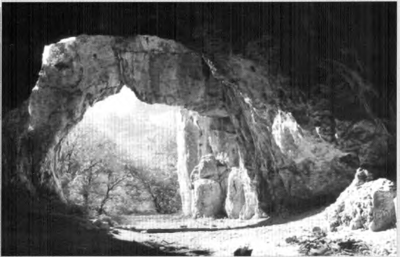
Мамонтова печера поблизу с. Вежхов'є (Польща)