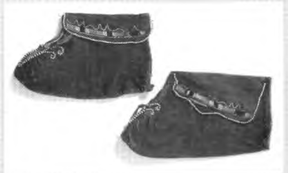
Мокасини. Долина ріки Св. Лаврентія або Схід Великих озер. Середина XVIII ст. Шкіра оленя. Аплікація перлами та голками дикобрава. L 22–24 см; h 12–13 см