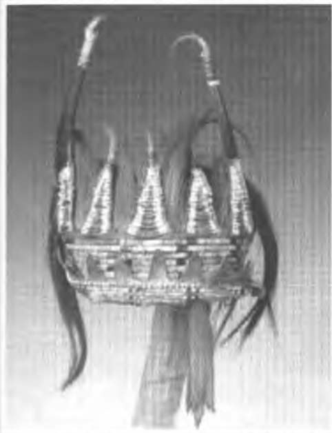
Головний убір. Схід Великих озер та рівнини Північного Сходу. Близько 1780 р. Ріг бізона, необроблена шкіра, фарбована шерсть оленя та коня, голки дикобрава. 50×11 см