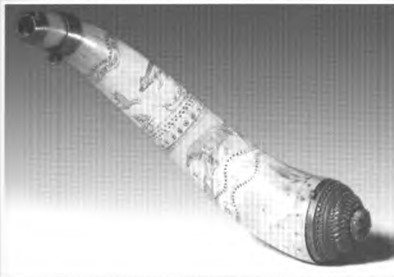
Ріг для пороху. Великі озера. Середина XVIII ст. Коров'ячий ріг, дерево, залізо. Довжина 34,5 см