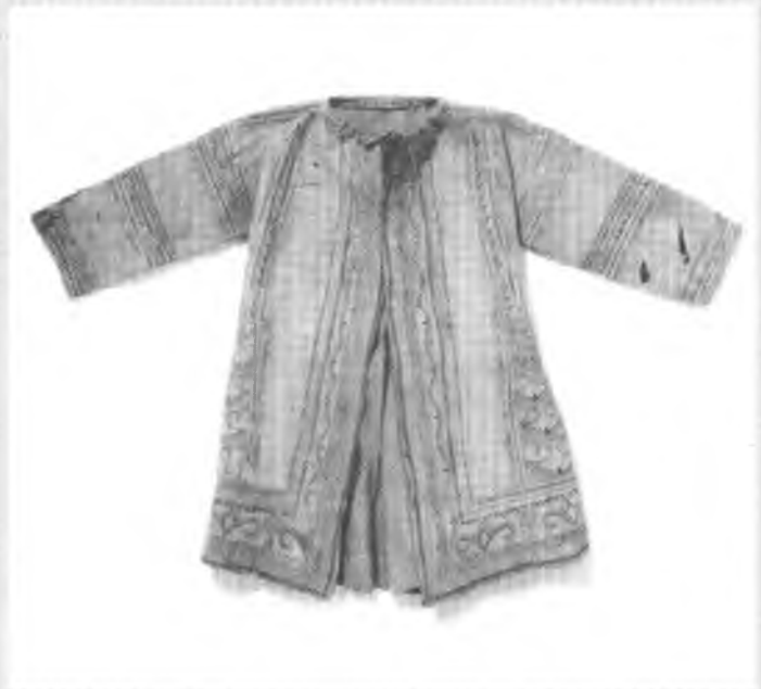
Монтанье-наскапі. Куртка молодого хлопця. Шкіра карібу. Вис. 56 см