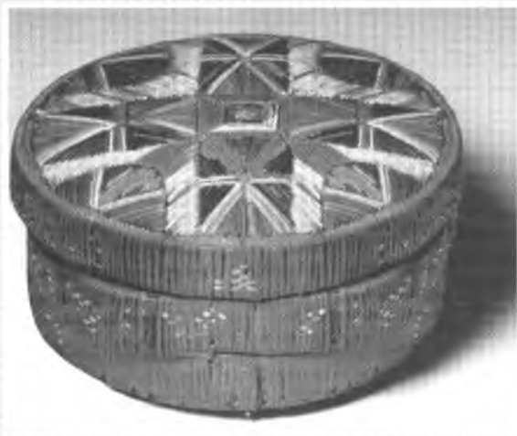
Мікмаки. Коробка. Друна пол. XVIII ст. Кора берези: плетення. Вис. 8 см., діаметр 16 см.