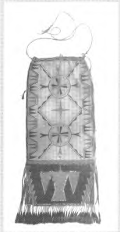
Розмальована торба з бахромою. Плем'я ожібва. Північний Схід Великих озер. Початок XVIII ст. Шкіра оленя. 51×21 см.