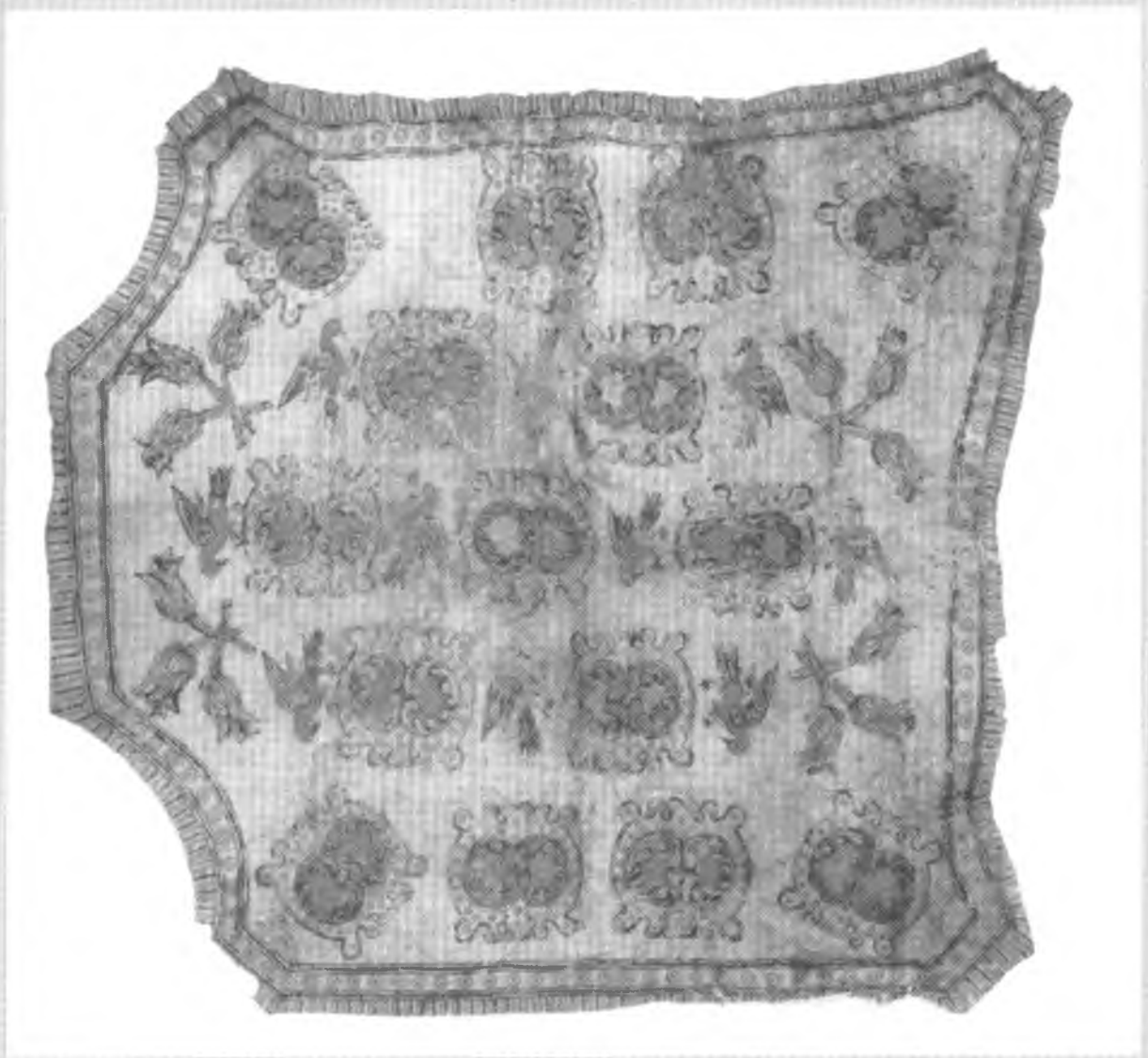
Накидка, розмальована птахами. Долина ріки Св. Лаврентія. XVIII ст. Шкіра оленя. Пігмент: чорний, червоний, зелений. 105,6×101,9 см