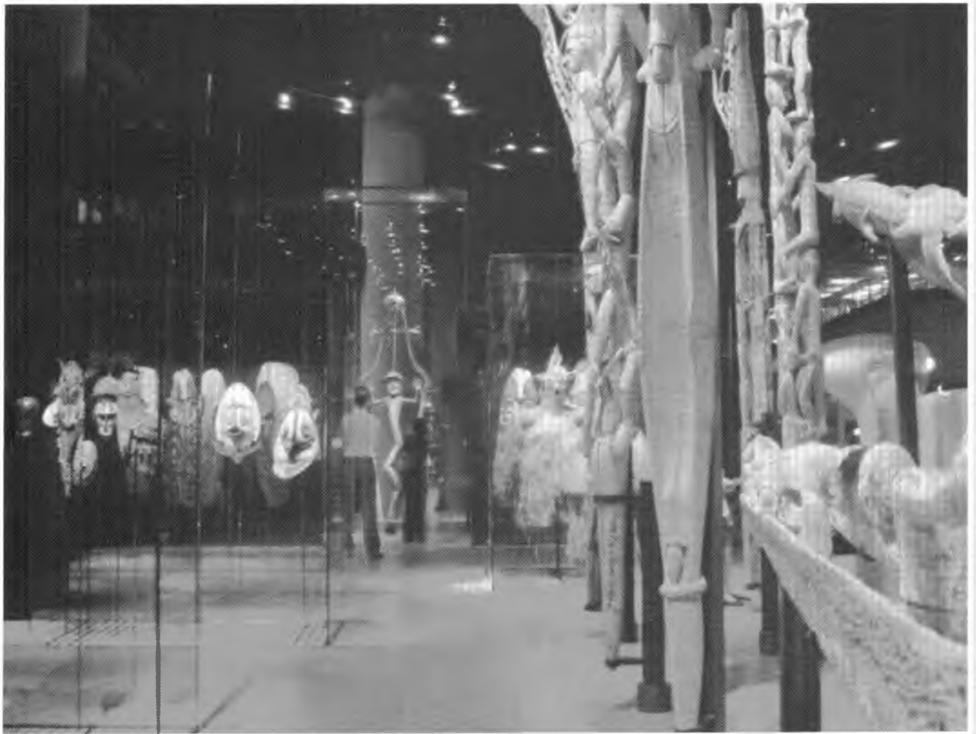
Інтер'єр експозиції зали африканського мистецтва