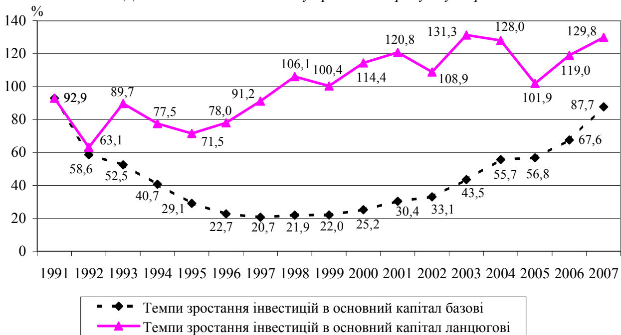
Рис. 4. Динаміка обсягу інвестицій в основний капітал промисловості України

У результаті аналізу обсягів інвестицій в основний капітал промисловості України, враховуючи, що саме цей фактор є основою зростання прибутків промисловості та рівня конкурентоспроможності національної