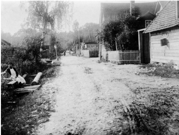
Вулиця в німецькій колонії Оранієнбаум. Експедиція 1930 р. Ф. 1, од. зб. 892, арк. 2

вили, где можно, несколько заглавий укр[аїнських] трудов (напр., стр. 16, примеч. 52 и др.).