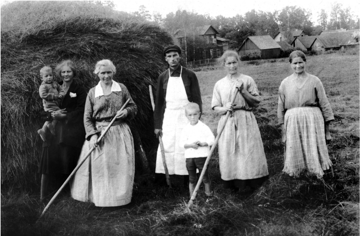
Жнива в німецькій колонії Оранієнбаум. Експедиція 1930 р. Ф. 1, од. зб. 892, арк. 3

сядь помер в Єсентуках. Нижче подаємо скорочену бібліографію праць Є. Кагарова, які є характерними для його "наукової фізіономії", як висловлювалися у 1920-і роки. При подачі бібліографічних джерел в круглих дужках зазначено номер, під яким дана праця знаходиться в списку робіт, поданих самим Є. Кагаровим: