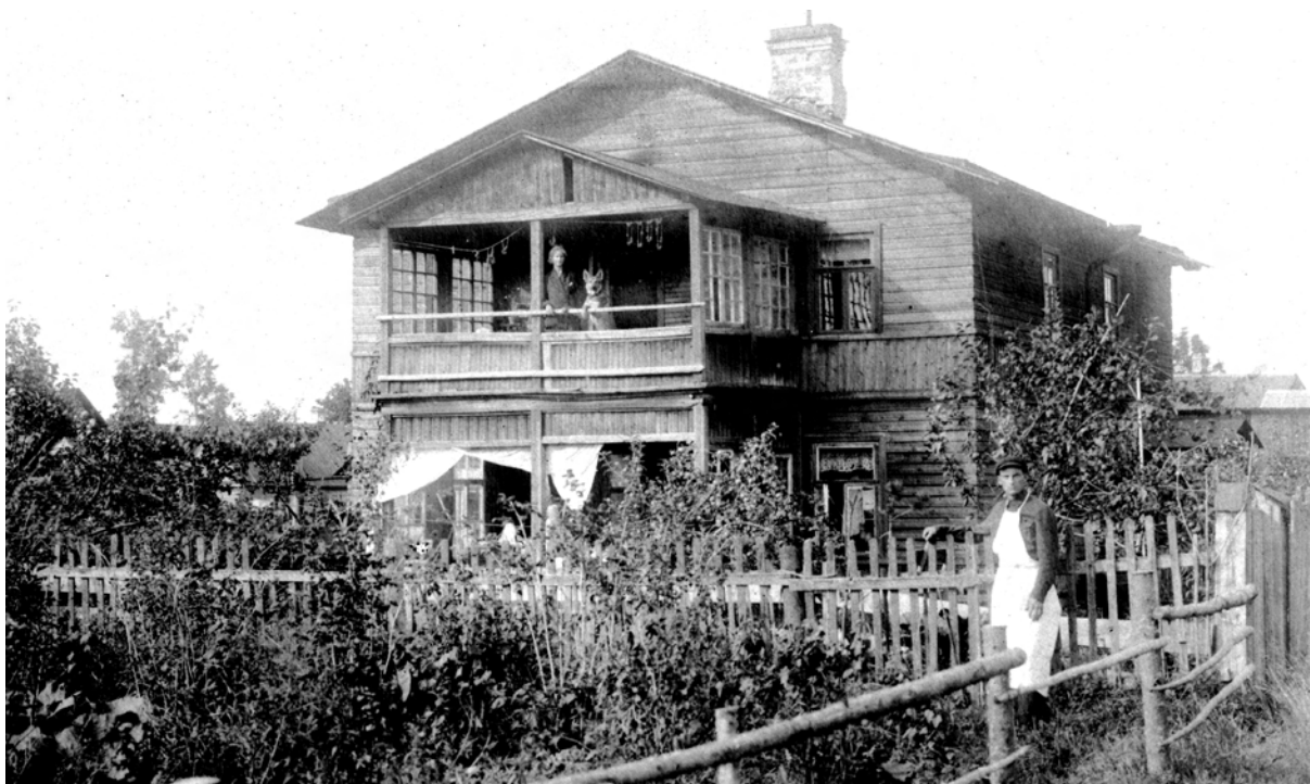
Будинок в німецькій колонії Оранієнбаум. Експедиція 1930 р. Ф. 1, од. зб. 892, арк. 1

которое взяло на себя рассылку выработанных мною анкет по сельским школам республики.