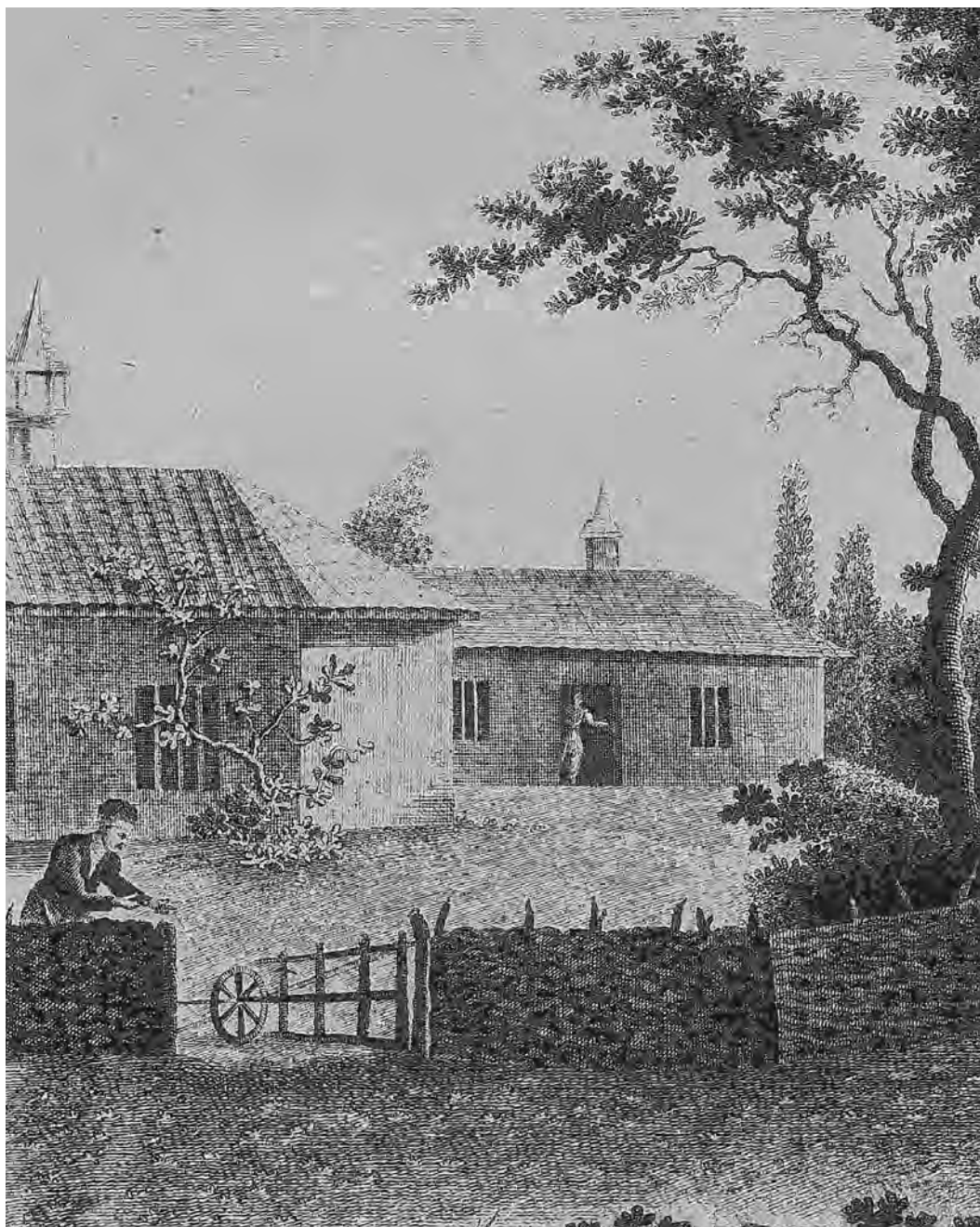
Мал. 2. Гравюра XVIII ст.

1. Озенбашлы Э. Крымцы. Сборник работ по истории, этнографии и языку крымских татар. — Акмесджит, 1997.