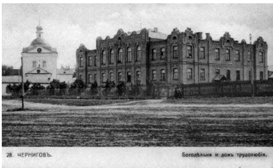
Будинок працелюбства. Поч. XX ст.