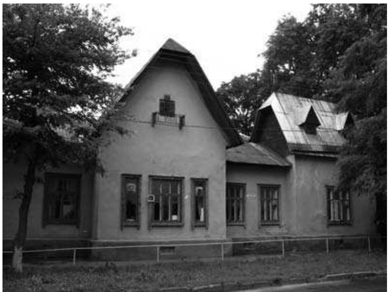
Колишній сирітський будинок. 2007 р.