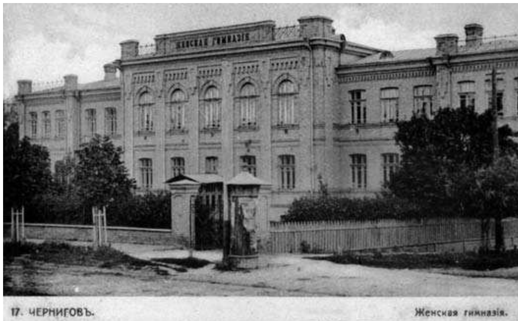
Чернігів. Жіноча гімназія. Поч. XX ст.

Важливою подією стало відкриття нового приміщення Чернігівської міністерської жіночої гімназії, яке збудували протягом року. Урочистості відбулись в актовій залі гімназії 19 вересня 1899 року. Про потреби цього навчального закладу, який з 1880-х років містився в одноповерховому дерев'яному будинку, що давно вже не відповідав вимогам часу, неодноразово йшла мова на сесіях міської думи та земських зборах. За браком коштів будівництво відкладалось багато разів і взагалі могло не відбутися, якби не добровільні пожертви. За кошторисом на новий будинок гімназії була необхідна величезна сума – 100000 крб. Таких коштів не могли надати ні міністерство освіти, ні міська дума. Тільки