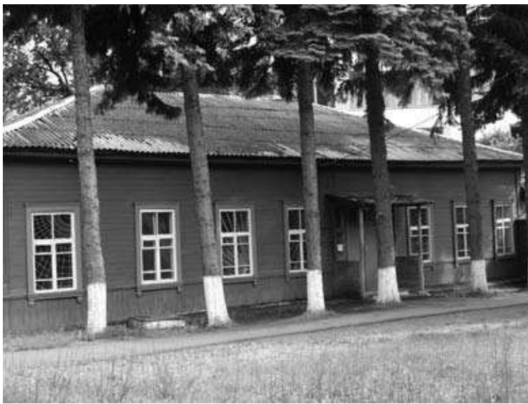
Колишня лікарня Общини сестер милосердя. 2007 р.

Спеціального фінансування з боку міської думи лікарня не мала і могла існувати лише за рахунок благодійних внесків або матеріальної допомоги з боку земства. З ініціативи голови попечительської ради на утримання установи збирались кошти, проводились благодійні вечори. Так, на утримання одного ліжка 240 крб. на рік виділяв Міський громадський банк 48 . У 1900 році надійшли кошти від “щедрою своею постоянною отзывчивостью на все благополезное” крупного промисловця Н.А. Терещенка: