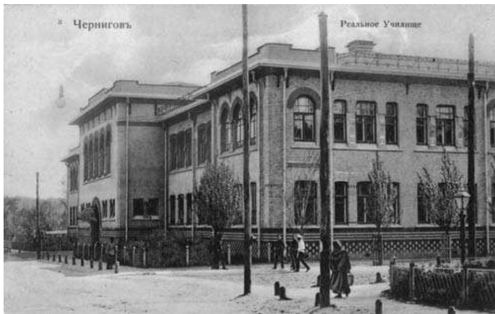
Чернігів. Реальне училище. Поч. ХХ ст.