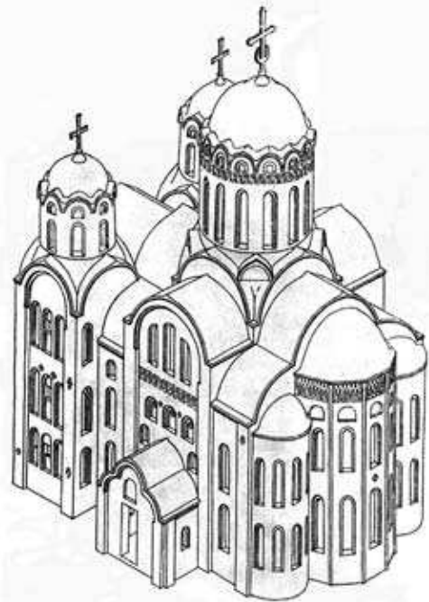
Київ. Церква Спаса на Берестові. 1113–1125 рр. Реконструкція Г.М. Штендера.

Як відомо, князь Володимир Мономах потурбувався, аби урочисто освятити 1 травня 1115 р. щойно відбудовану церкву Бориса і Гліба у Вишгороді, а в 1117 р. заклav церкву Бориса і Гліба “на Лытк”, де в 1015 р. вбили князя Бориса 22 . Там