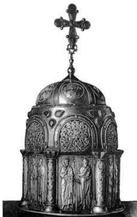
Великий сіон Софійського собору в Новгороді. Київ, перша чверть XII ст. Новгородський державний об’єднаний музей- заповідник.

В Новгороді, в соборній Софійській ризниці зацілили срібні сіони у вигляді увінчаних хрестом купольних ротонд 33 . Великий сіон досі продовжують сприймати як витвір, виконаний у Новгороді, цілком слушно датуючи першою чвертю XII ст. 34 Його безпосередній взірець – малий сіон має царгородське походження першої половини XI ст. 35 Власне доказів на користь новгородського походження великого сіона насправді не наведено, їхня відсутність, ніби компенсується впевненістю в тому, що саме так має бути. Не лише іконографія, але й художній стиль, манера виконання, декоративні мотиви, нарешті техніка – все це вказує на причетність до виконання ніяк не місцевих новгородських, а ймовірніше елітарних царгородських майстрів. Варто придивитися уважніше до карбованих струнких постатей апостолів, моделювання яких з такою пластичною виразністю було складною справою. Треба