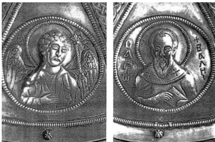
Архангел Михаїл. Свт. Василій Великий. Зображення на куполі Великого сіону.