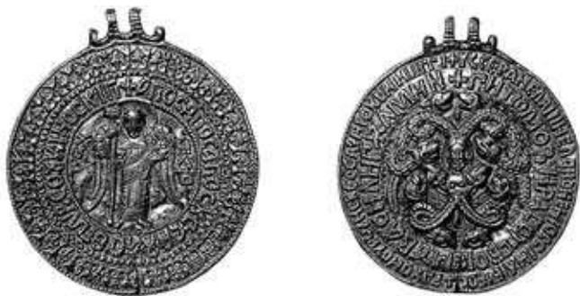
“Чернігівська гривна”. 1084–1094 рр. Санкт-Петербург, Державний Російський музей.

на звороті – жіноча голова в центрі гадючих в оточенні слов’янського й грецького текстів. Якість пластичного виконання така, що виготовлення речі слід припустити лише у князівській золотарській майстерні, де мали працювати досвідчені візантійські ювеліри, і те могло бути саме в Києві. Особливу увагу варто звернути на бісерні написи, що наче імітують низання перлами. Унікальність твору з хрестильним ім’ям Володимира Мономаха (Василій) однак не зашкодила його популярності, на що вказують, мідні відтворення 32 . Себто елітарні вироби могли “репродукувати” й поширювати в дешевих варіантах.