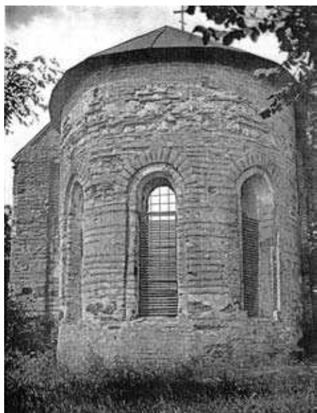
Остер. Вівтарна апсида церкви св. Михайла (Юр'євої божниці). Близько 1100 р.

Неможливо заперечувати, що Володимир Мономах насправді був найбільш видатною особистістю з усіх князів, пов’язаних з Переяславом 13 . Під його владою крім власне Переяславської землі опинилися величезні волості. Стольне місто заходами митрополита Єфрема було належно прикрашене багато оздобленими храмами, про що, зокрема, повідомляє літопис з приводу освячення в 1090 р. церкви архангела Михайла, згадуючи при цьому про закладені церкви – надвратну Федора Стратилата та Андрія Первозваного біля воріт 14 . Князь Володимир Мономах, як вже зазначено, в 1098 р. закладає кам’яну церкву Богородиці на княжому дворі. Залишки цієї споруди звичайно вбачають у невеличкій (20 × 12 м) тринавній чотиристовпній розташованій у княжій частині дитинця церкві. Під час її розкопок в 1958 р.