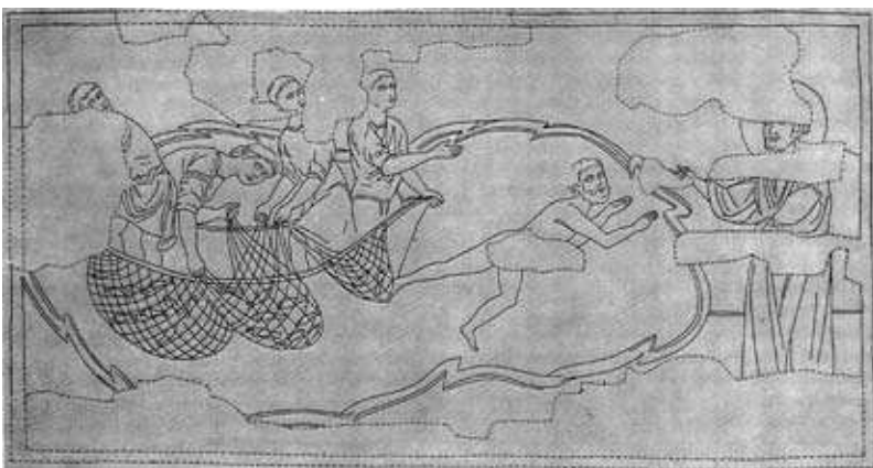
Чудесний лов риби. Фреска церкви Спаса на Берестові. 1113–1125 рр. Реставраційне промалювання.