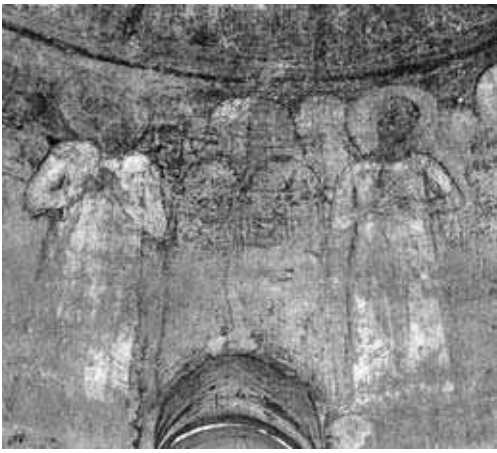
Євхаристія, фрагмент. Фреска віттарної апсиди церкви св. Михайла в Острі. Поч. XII ст.

візантійським творам. М.О. Макаренко зауважив, що фрески Остерської (Юр'євої) божниці мають чимало спільного з киево-софійським стінописом, але неможливо не помітити також розбіжності, котрі мали бути на початку XII ст. “Нині, – пише дослідник, – загальне вражіння від рештків розписи безраднісне і в розумінні їх цілості, а також і з погляду кольорових завдань. Здається тепер, що вся поверхня вкрита брунатно-червоними плямами то більш, то менш густими, інтенсивними силою фарби. Іноді між ними помічаємо вкраплення жовтої, зеленої, голубої та білої фарб. Коли-ж придивитися до розписи, то можна помітити певну і не погану розмальовку. Гра теплих тонів з холодними, уміло і художньо розміщених” 19 .