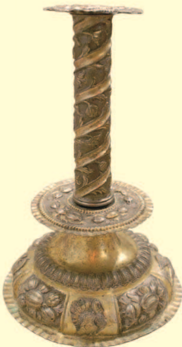
Свічник Інв. № И-2687, 3230, 3233