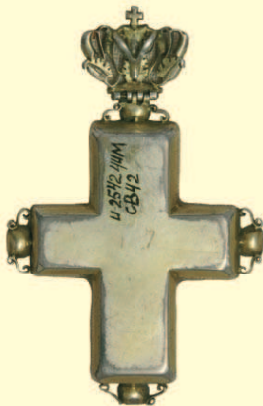
Інв. № И-2542