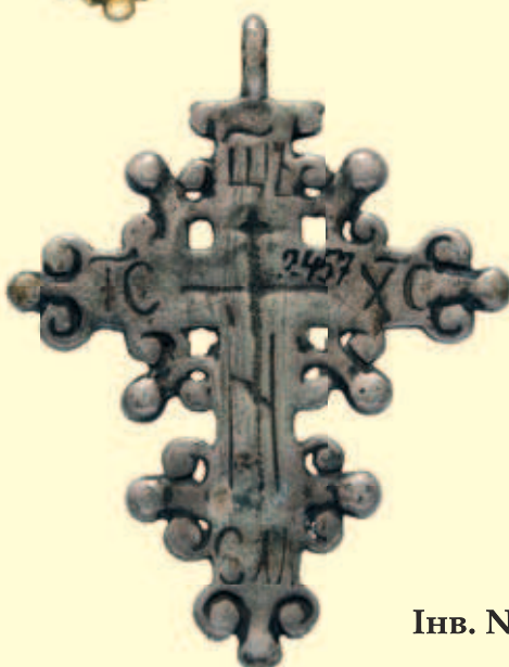
Інв. № И-2457