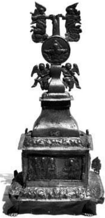
Дарохранильниця И-2604, И-2619.

ські сцени: “Моління про чашу” і “Несіння хреста” (бічні стінки), “Жінки-мироносиці біля труни” (передня стінка), “Покладання в домовину” (задня стінка). Досконалістю виконання позначені всі сюжети, окрім “Моління про чашу”, де не витримані пропорції, що значно знижує художню значимість твору. Над саркофагом здіймається висока пірамідальна гладка кришка з навершям у вигляді двобічного медальйона, на якому карбовані поясна фігура Бога Отця (лицевий бік) та Спас Нерукотворний (зворотний бік). Увінчував композицію шпиль з Воскреслим Христом у сонячному сяйві (утрачений). Декоративність пам’ятки підсилює орнамент з акантових завитків, що суцільно вкривають бордюри саркофага і піраміди, та смужки хрестоцвіту як відгомін готичних мотивів. Вісім литих янголів, що рясно прикрашали гробницю, надавали творові монументальності і завершеності. Проте, вона пошкоджена і окремі деталі втрачені (декілька вдалося віднайти під час підготовки публікації). У повоєнні роки пам’ятка отримала два інвентарні номери (інв. № И-2604 – власне гробниця, И-2619 – кришка; К.Т. № 15).