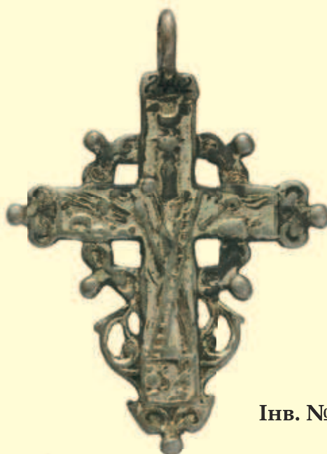
Інв. № И-2442