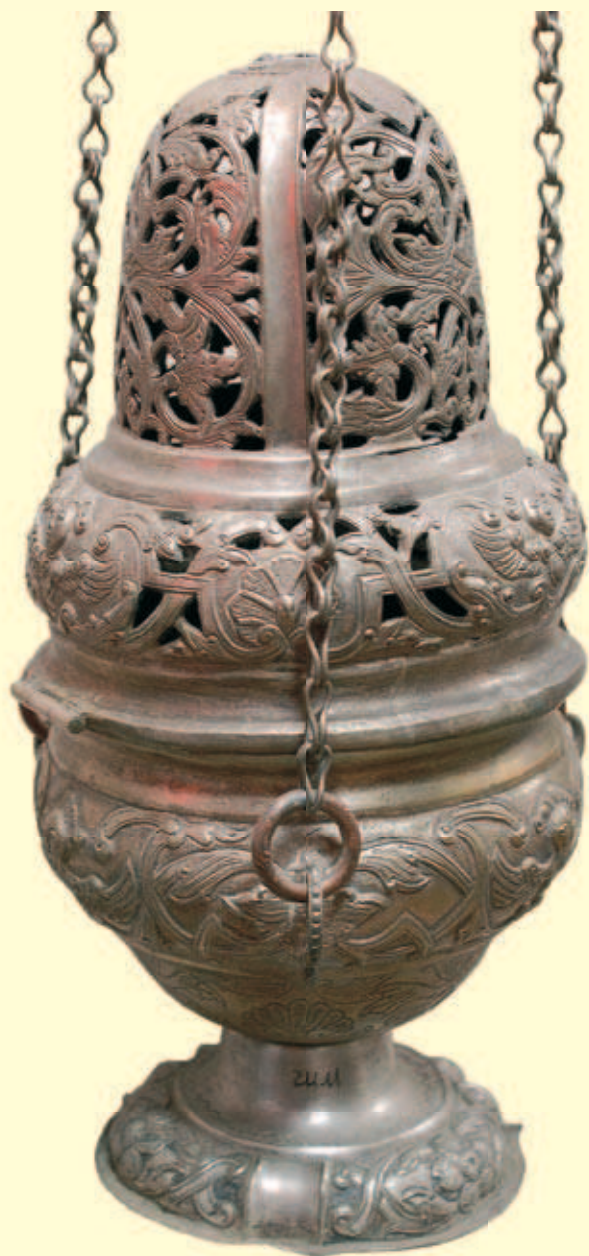
Кадильниця Інв. № И-2682