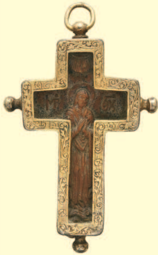
Інв. № И-2486