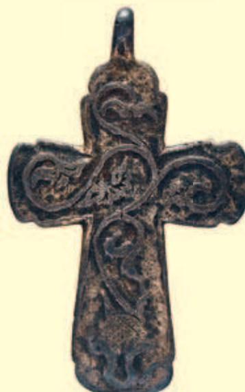
Хрест натільний Інв. № И-2451