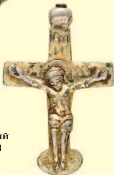
Хрест натільний Інв. № И-2458