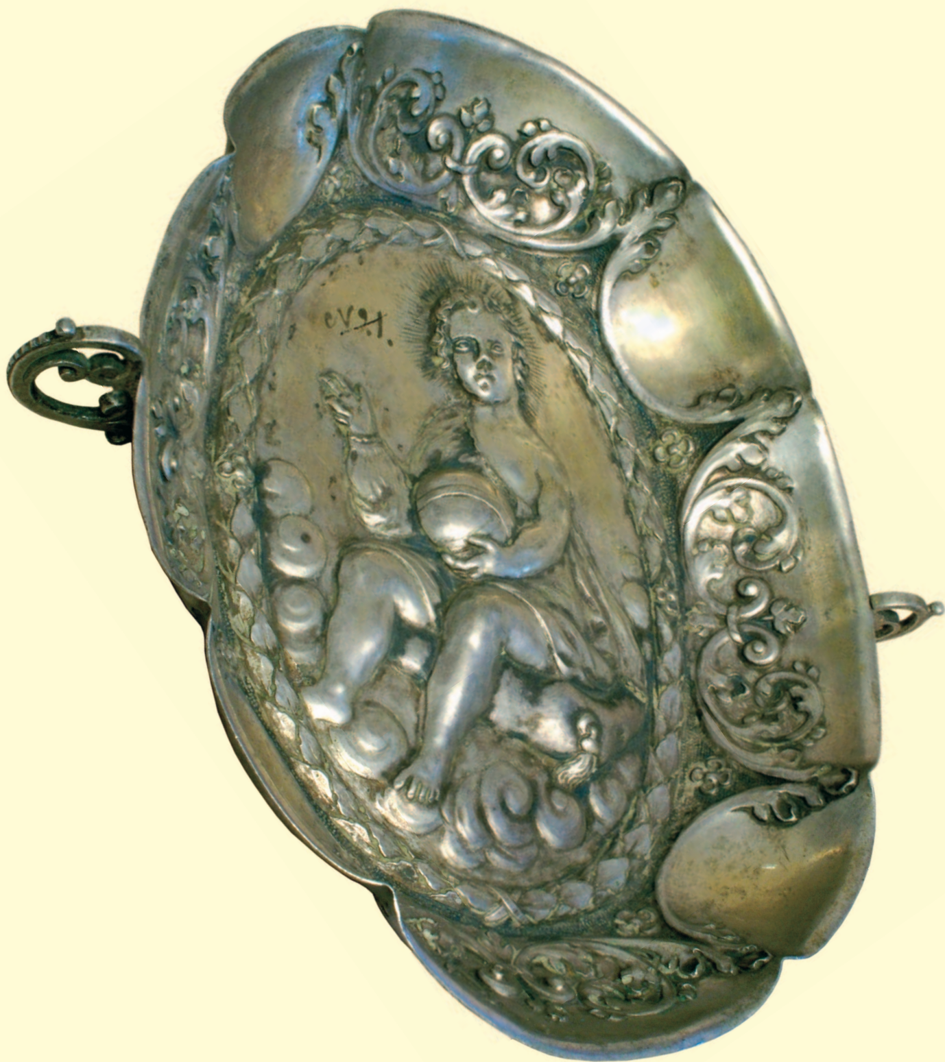
Ківшик Інв. № И-36