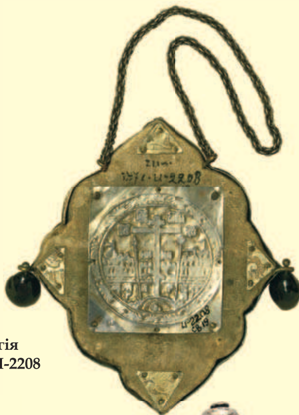
Панагія Інв. № И-2208