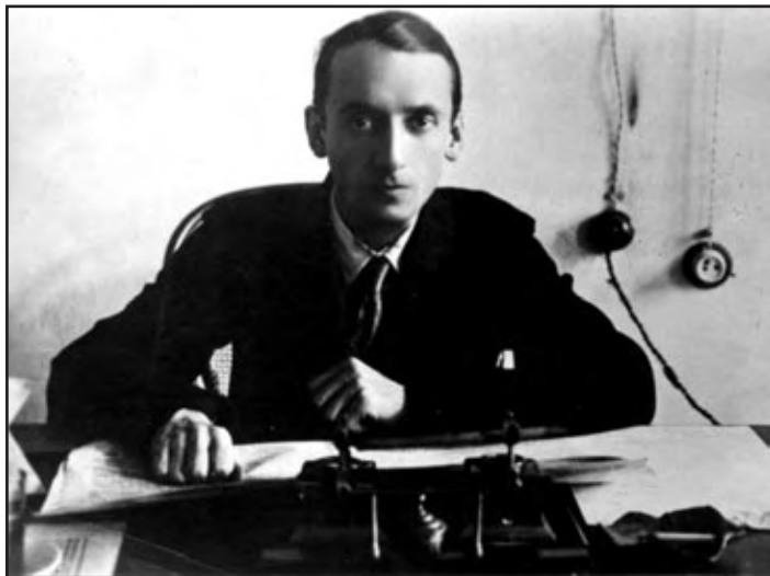
Г.Ф. Ланчинський, голова Чернігівського губревкому. 1919 р.