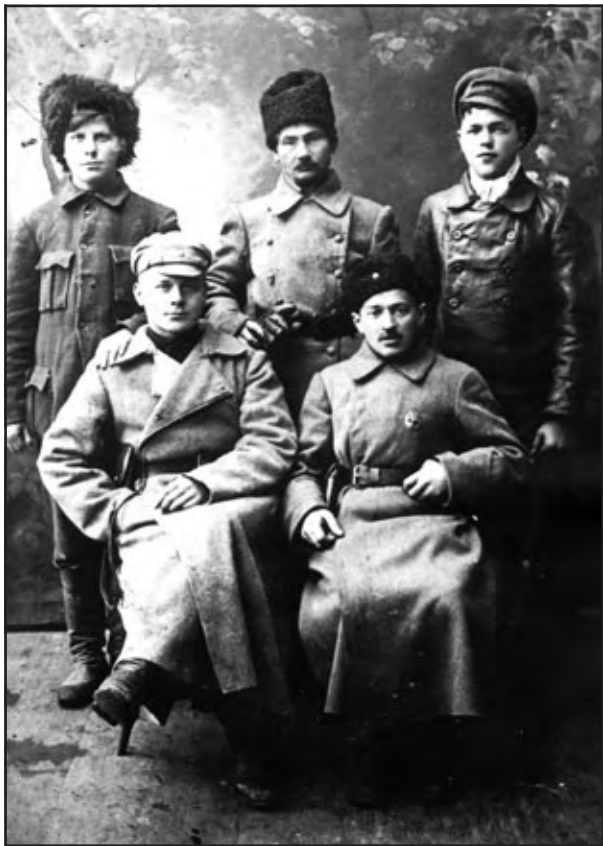
Бійці Богунського полку, які брали участь у боях з денікінцями на Чернігівщині. Листопад 1919 р.

5 листопада частини 60 дивізії увірвались до Чернігова зі сходу. З півночі в місто вступив 2-й полк Таращанської бригади. Напружені бої тривали добу. Ось чому в різних джерелах зустрічаємо різні дати визволення Чернігова. Здебільшого це – 7 листопада, коли денікінці, переправившись через Десну, закріпилися на її лівому березі поблизу нинішнього шосейного мосту, в районі колишнього залізничного вокзалу. Звідти почали обстрілювати місто з гармат, влучили у будинок семінарії, де на той час вже перебував військовий шпиталь, лише 12 листопада вони відступили від Десни у напрямку Анисів – Лукашівка. 21 листопада були звільнені Ніжин, ст. Крути, 1 грудня – Прилуки.