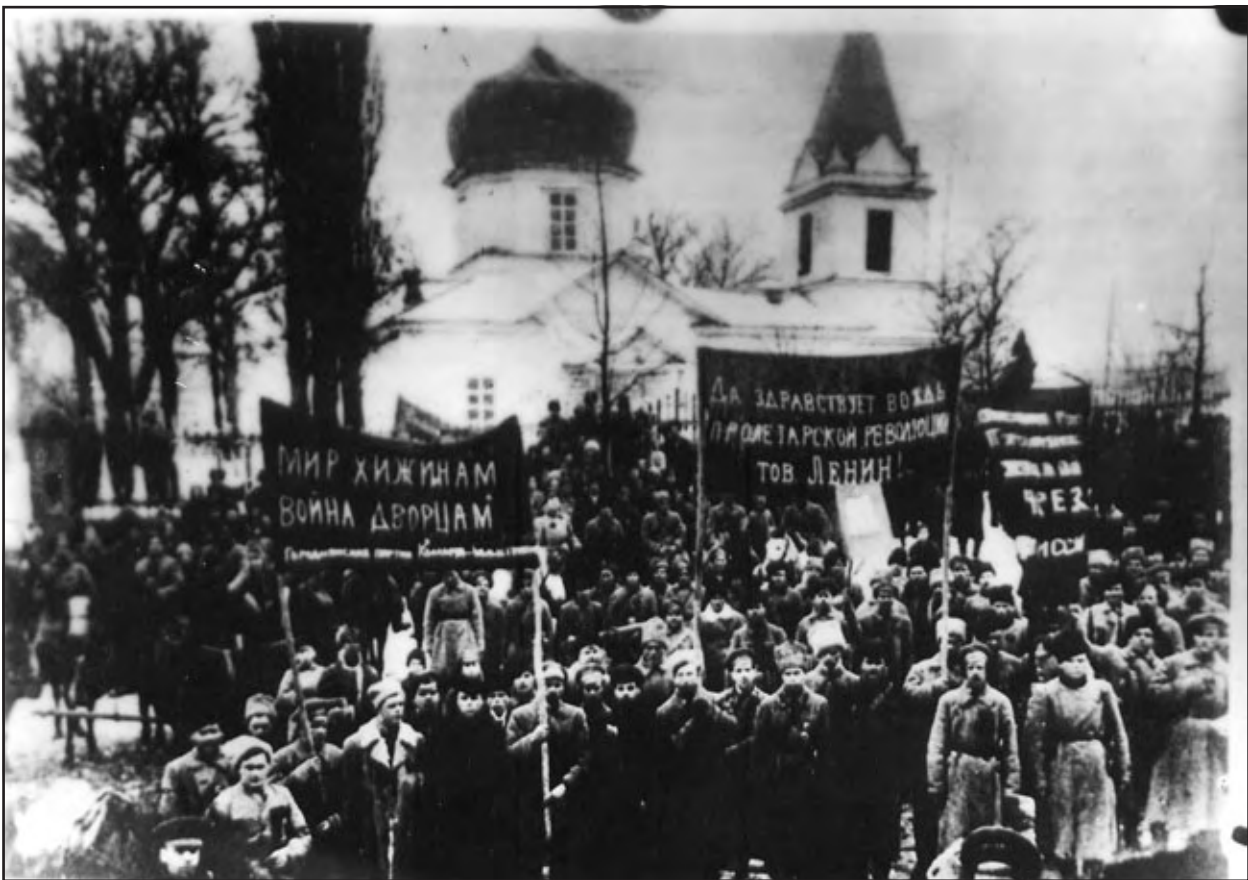
Маніфестація в Городні з приводу вступу до міста Богунського полку. 31 грудня 1918 р.

Богунський полк просувався у напрямку Новозибків – Клишів – Чернігів; Таращанський йшов на Городню – Сосницю – Борзну; Ніжинський – із Семенівки на Корюківку – Сосницю – Мену – Ніжин – Бахмач, де зустрівся з таращанцями; Новгород-Сіверський полк – на Новгород-Сіверський – Кролевець – Конотоп.