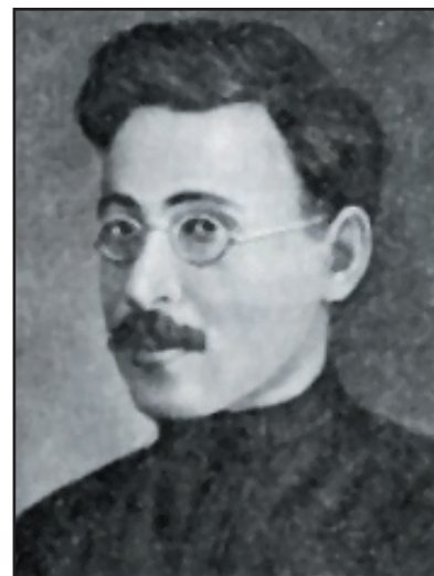
М. Глібов-Авілов, голова Чернігівського губревкому наприкінці 1919 – початку 1920 р.

Народився у Калузі. Навчався у партійній школі в Болоньї. У травні – червні 1918 р. – головний комісар Чорноморського флоту. З грудня 1918 р. – член колегії Народного комісаріату праці РРФСР, член президії і секретар ВЦРПС. Як представник Реввійськради 12 армії 28 жовтня 1919 р. очолив Чернігівський губревком. Згодом – нарком праці України. З 1923 р. – голова Петроградської ради профспілок. У 1928 р. – голова будівництва, директор заводу “Ростсільмаш” (Ростов-на-Дону). Заарештований у вересні 1936 р. за приналежність до контрреволюційної терористичної організації. Розстріляний. Реабілітований у 1956 р.