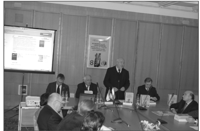
Директор Бюро надання доступу та архівізації документів Інституту національної пам'яті Польщі Р. Леськевич, в.о. Голови ІНП Польщі Ф. Грицюк, професор Ю. Шаповал, начальник Галузєвого державного архіву СБ України С. Кокін під час презентації 8-го тому у Києві.

Виконувач обов'язків голови Інституту національної пам'яті Республіки Польща Францішек Грицюк також наголосив на важливості польсько-української співпраці: «З-поміж найближчих держав Центральної Європи, з якими інститут налагодив співпрацю, з Україною вона приносить найбільші результати [...] Хотів би відзначити, що та ситуація, яка є в Польщі, яка дотична між іншим до певних змін у діяльності Інституту національної пам'яті (згадаймо, що кілька місяців тому відбулася зміна його статуту), ця ситуація жодним чином не вплине на наші взаємини. Із польської сторони ми проголошуємо абсолютну