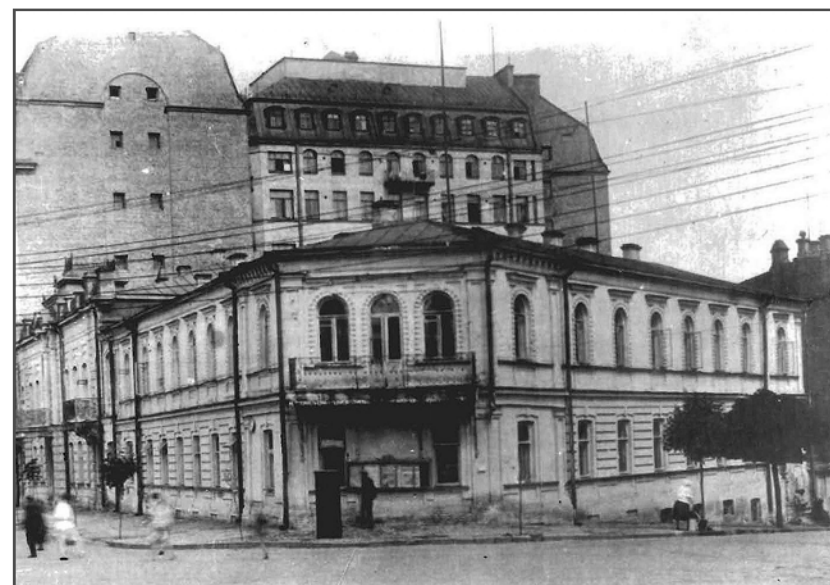
Будівля Гідрометслужби України на вул. Короленка, 21 (зараз — вул. Володимирська). Київ, 1935 р.