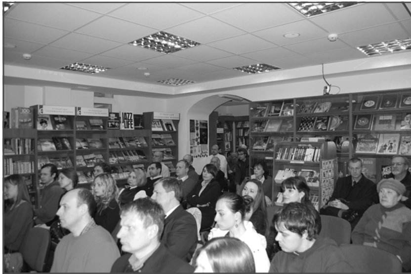
Присутні на презентації науковці, журналісти, зацікавлені особи.

лежності своєї держави, відтворив передумови й окреслив основні етапи військово-організаційної розбудови зазначеного збройного формування. Також автор реконструював однострої, відзнаки та структуру «Карпатської Січі».