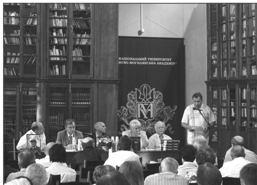
Обговорення книги «Великий терор в Україні. “Куркульська операція” 1937–1938 рр.».