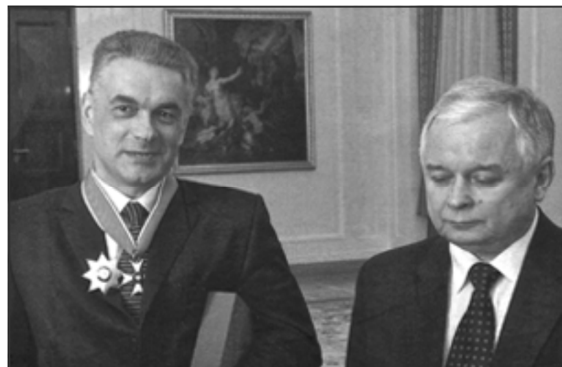
Януш Куртика та Лех Качинський. 2009 р.

Він був лауреатом премії імені Адама Хеймовського (1996 р.), другої премії у конкурсі імені Клеменса Шанявського (1998 р.), премії імені Й. Лелевеля (2000 р.), премії імені Є. Лойка (2001 р.). У 2008 р. 3-й Президент України Віктор Ющенко нагородив його орденом «За заслуги III ступеня» за значний особистий внесок у справу зміцнення авторитету України в світі, популяризацію її іс-