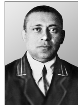
Лев Рейхман. 1920-ті рр.