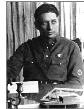
Давид Перцов. 1930-ті рр.