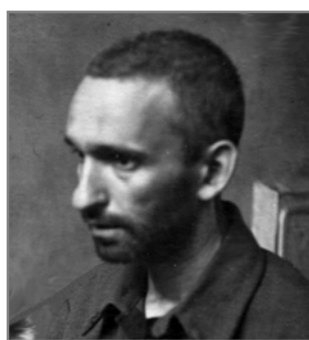
Арон Геплер до і після арешту. 1938 р.