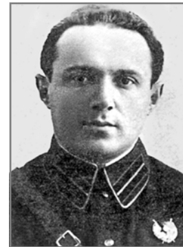
Олександр (Ізраїль) Радзивилівський. 1936 р.