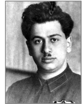
Генріх Люшков. 1920-ті рр.

Привертають увагу резонансні факти втечі чекістів за кордон. У сталінському СРСР це були рідкісні випадки. І тут маємо певну «єврейську специфіку», адже всі чотири відомих збіглих чекіста були євреями. Це начальник УНКВС по Далекосхідному краю комісар державної безпеки 3-го рангу Генріх Люшков (колишній начальник інформаційного, секретного та